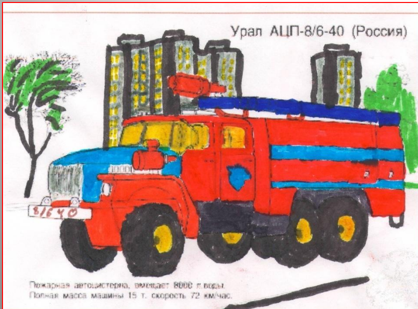
Пожарная автоцистерна, вмещает 8000 л. воды. Полная масса машины 15 т. скорость 72 км/час.