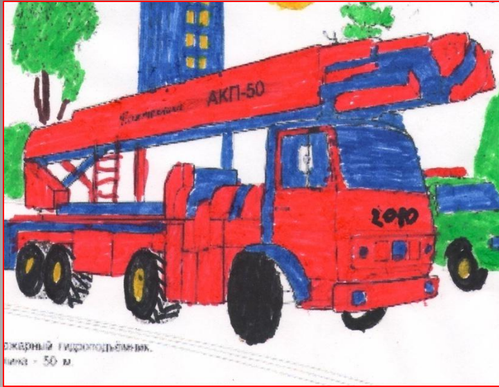
Экстренный гидротельферный лифт - 50 м.

Пожарные – люди, которые рискуя жизнью, борются с огнём.