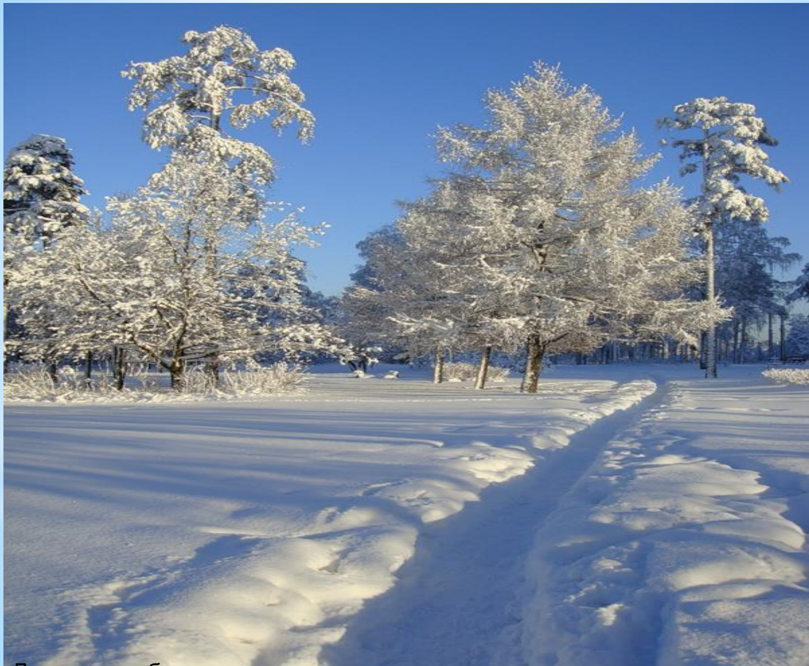
Дети в сугробе тропку протоптали