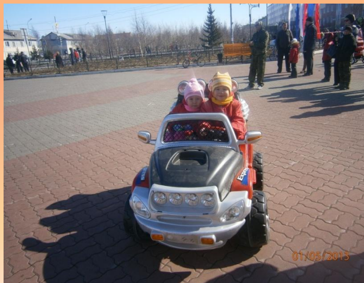
Кататься на машинках