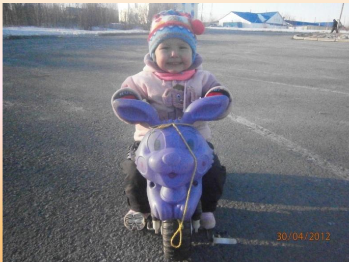
Кататься на велосипеде