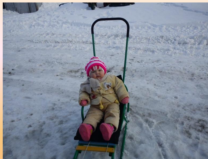
Кататься на санках