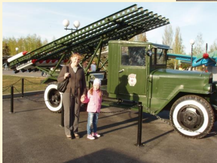
Посещение детей с родителями мероприятий по празднованию Дня Победы в других детских садах.