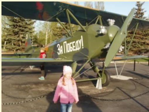
Посещение Парка Победы в г.Казани