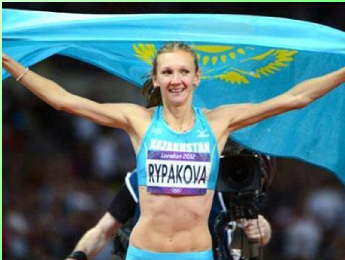
Ольга Рыбакова, рекорд тройного прыжка – 15.25м, 2010г.