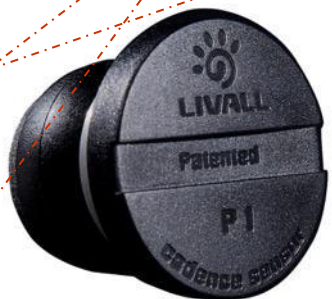
Датчик вращения P1