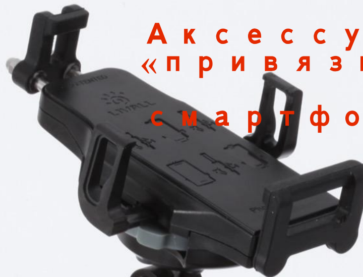
Контроллер Bling Jet BJ100