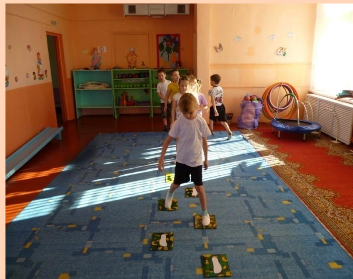
Фрагмент занятия «С кочки на кочки»