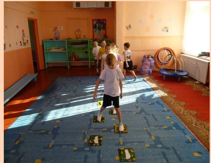
Фрагмент занятия «С кочки на кочку»