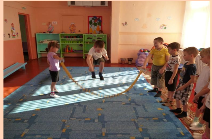
Фрагмент занятия «Скакалка»