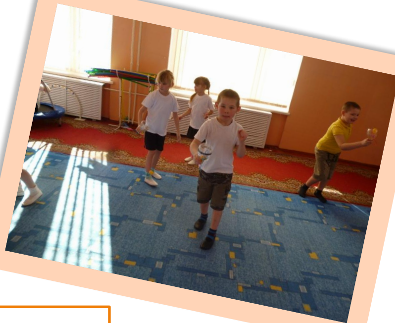
Фрагмент занятия «Бильбоки»