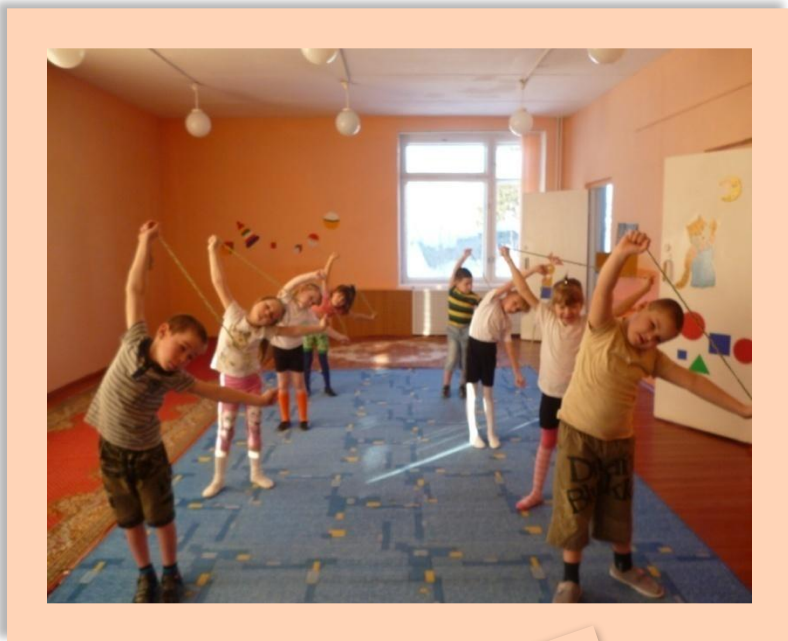
Фрагмент занятия с «Косичками»