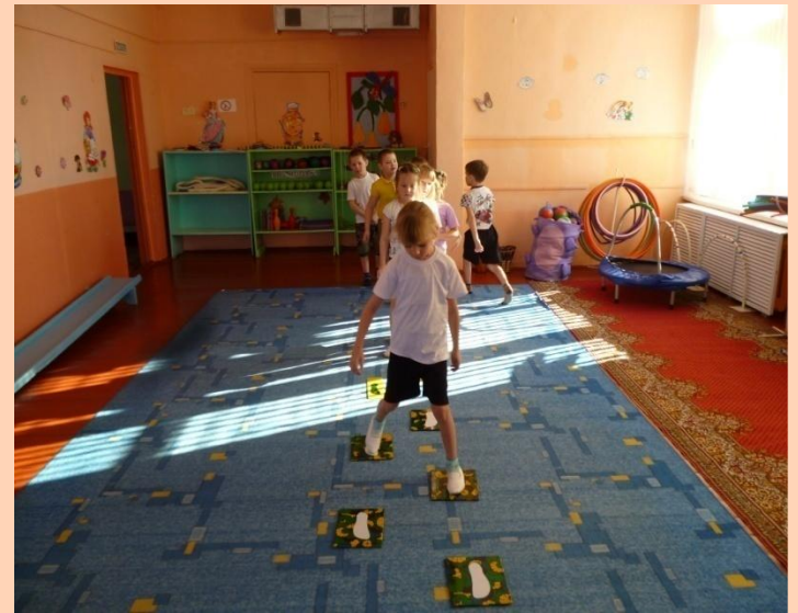
Фрагмент занятия «С кочки на кочку»