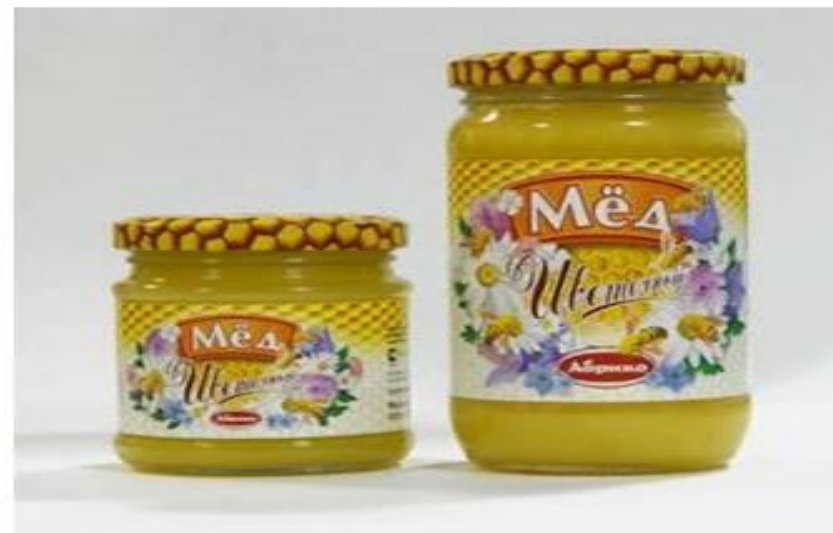
5. Банка с мёдом.