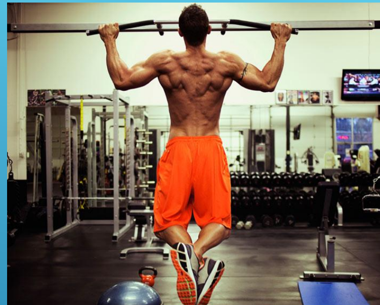
Упражнения в преодолении собственного веса