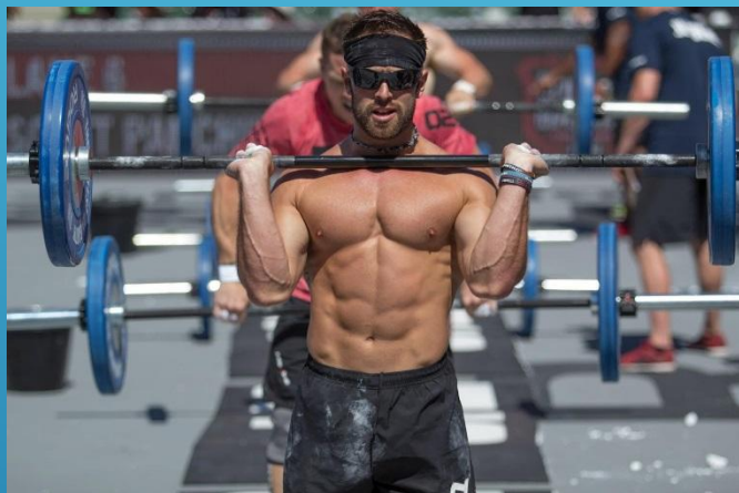
Упражнения с внешним сопротивлением