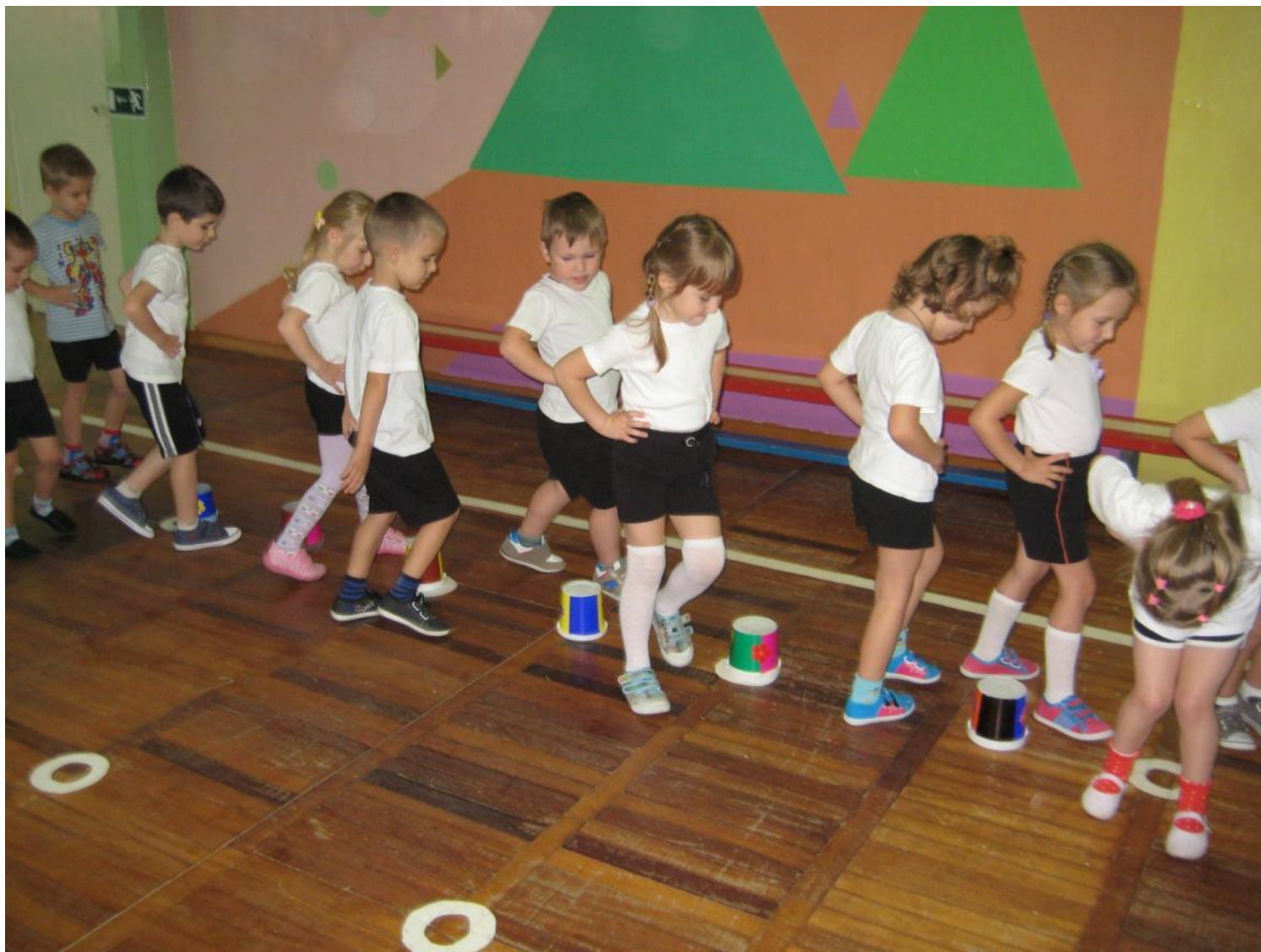
Ходьба и бег змейкой