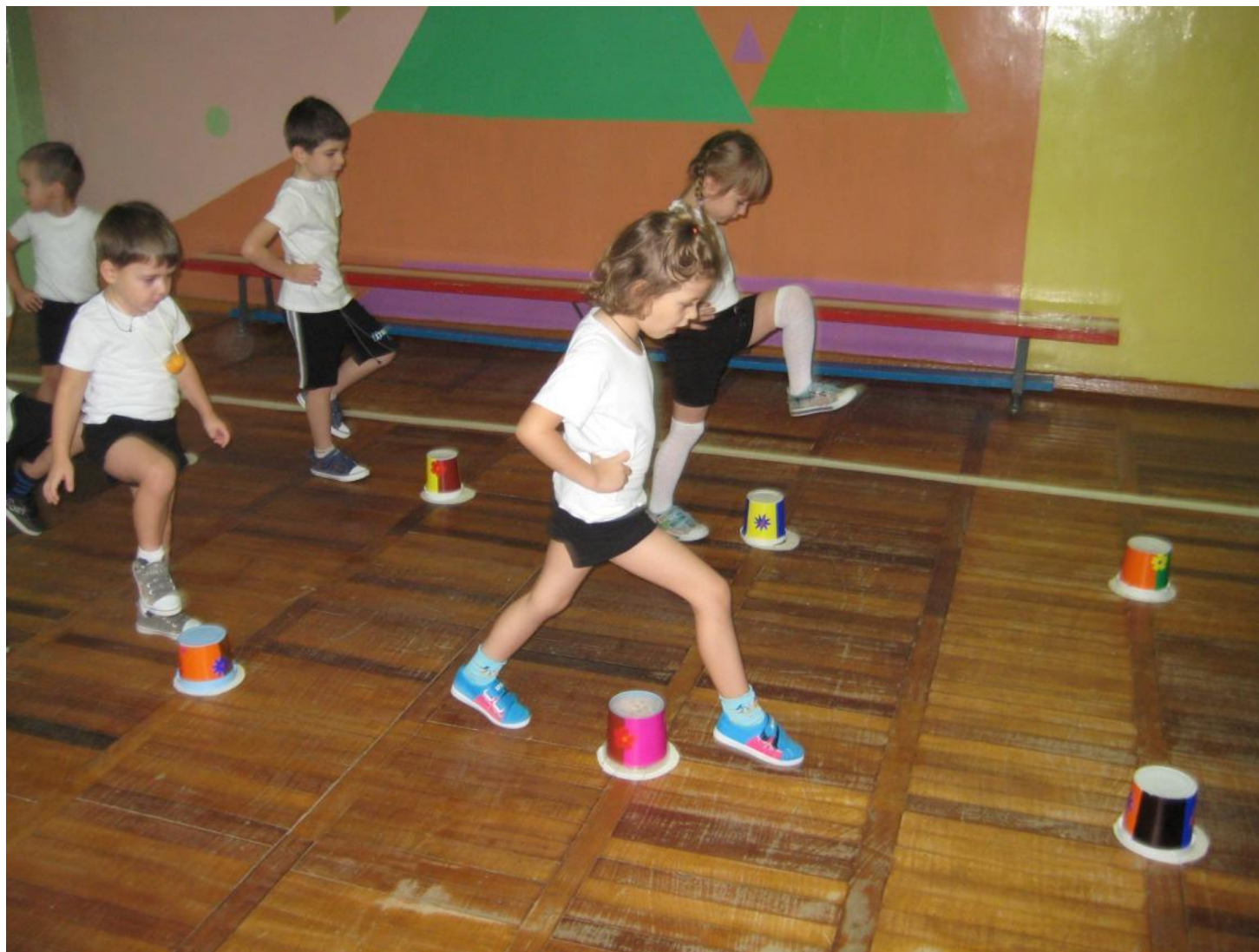
Ходьба с перешагиванием