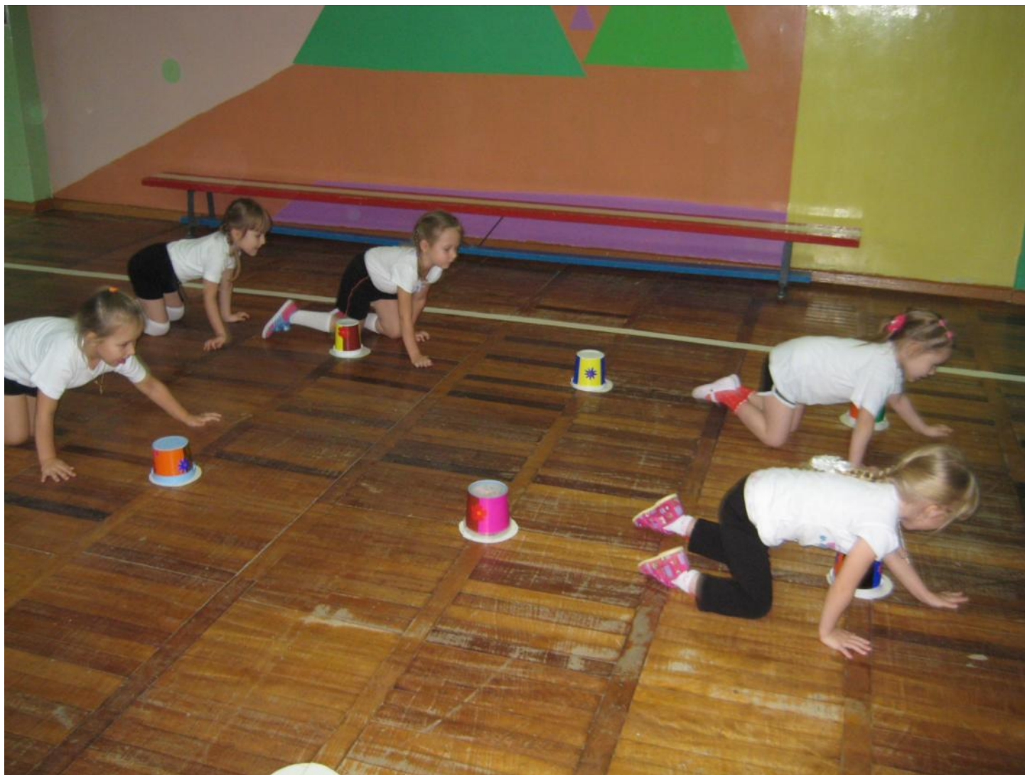
Ползание на четвереньках змейкой