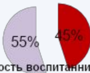
Рис.2. Численность воспитанников с учетом гендера