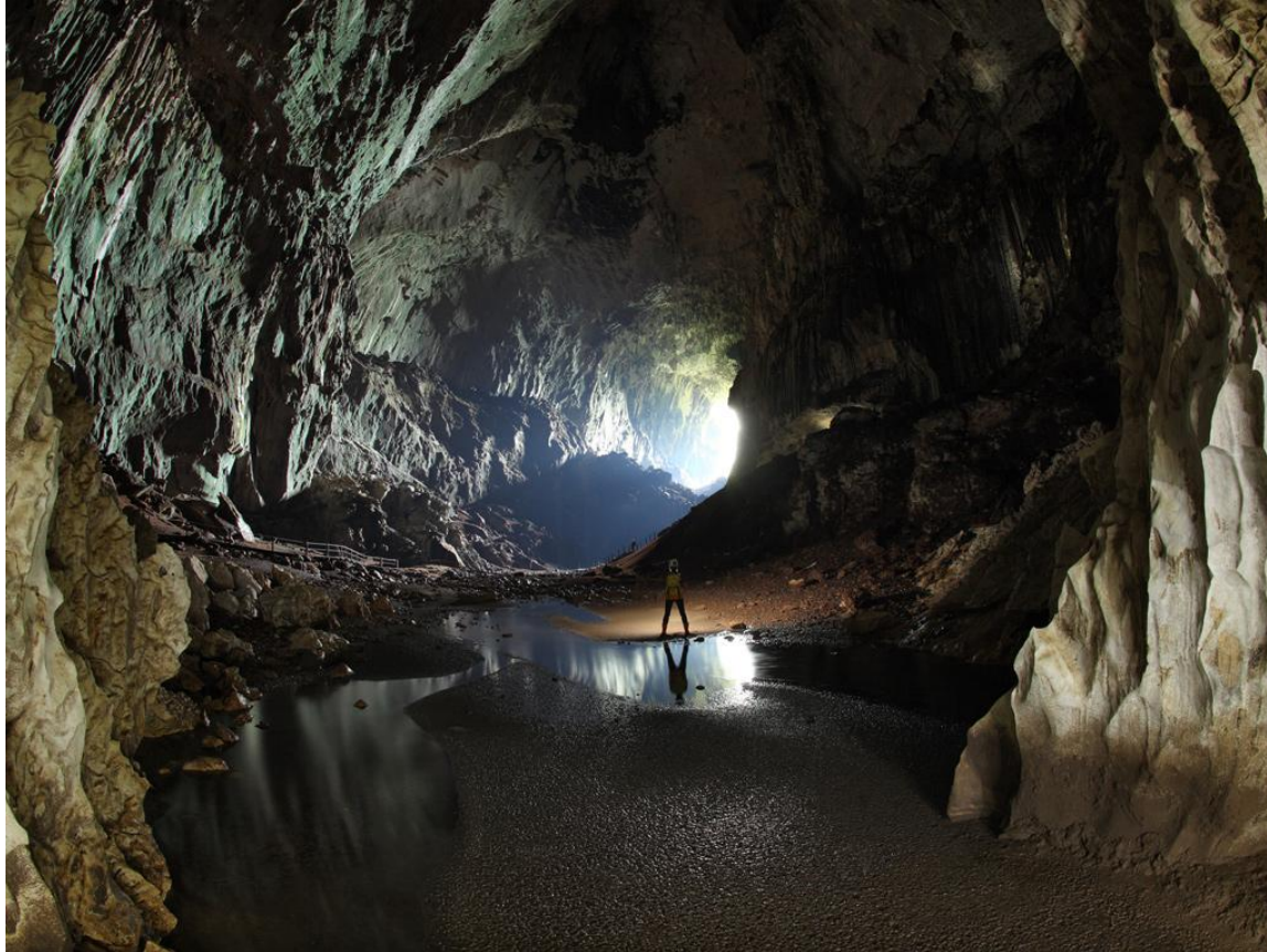
Пещера Гунунг-Мулу Малайзия