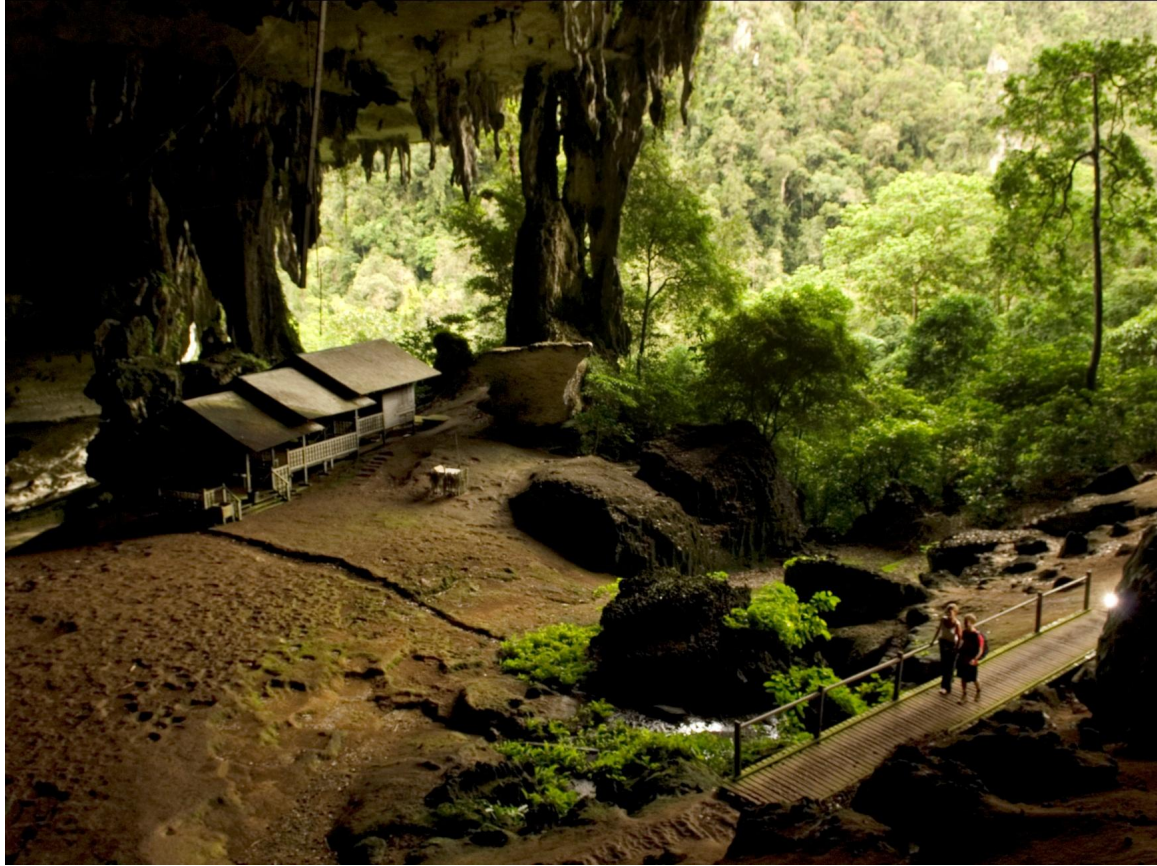
Пещера Гунунг-Мулу Малайзия