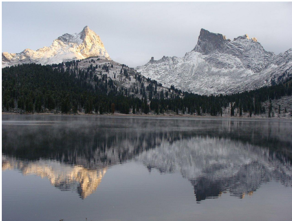
Пик Звездный, 2265 м.н.у.м., 12 июля 2011 года.