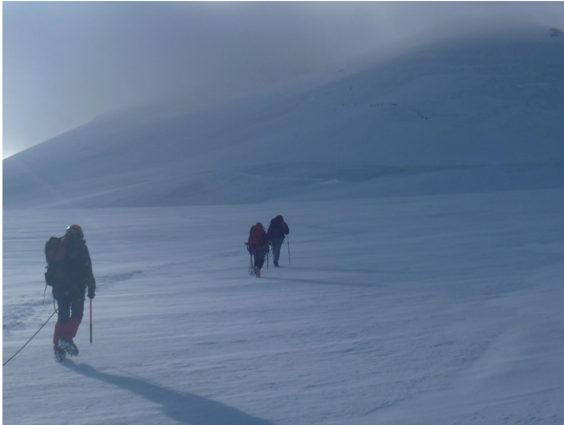
Восхождение на в.Казбек 5050 м.н.у.м., август 2011 года.