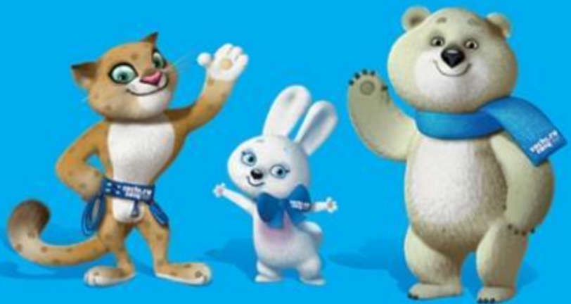
Талисманы XXII Олимпийских зимних 2014 года в городе Сочи

Олимпийская эмблема – сочетание переплетенных колец с какими-нибудь элементами. К примеру на эмблеме Олимпийских Игр в Москве 1980 г вместе с Олимпийскими кольцами изображался силуэт высотных зданий, башни Московского Кремля и беговые дорожки стадиона