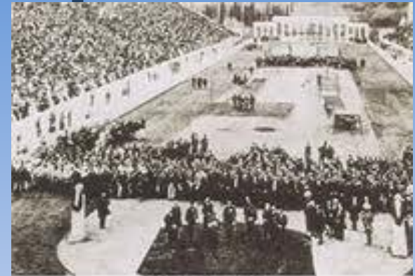
ОТКРЫТИЕ I Олимпийских игр 1896 года