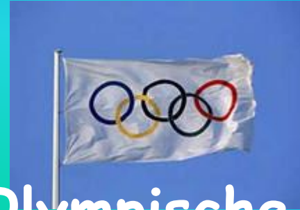
Die Olympische Flagge