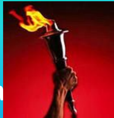
Das Olympische Feuer