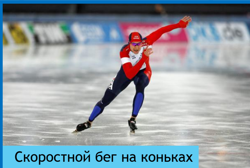
Скоростной бег на коньках