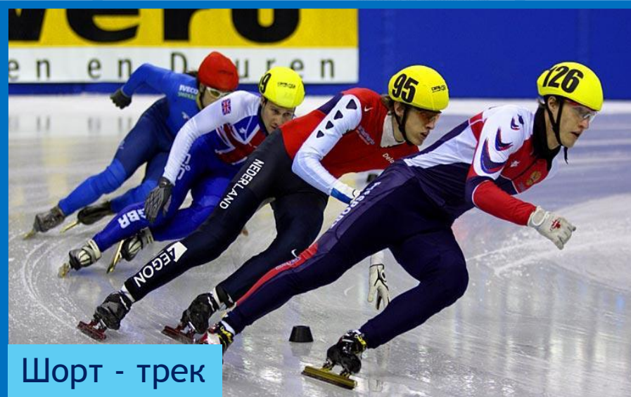
Шорт - трек