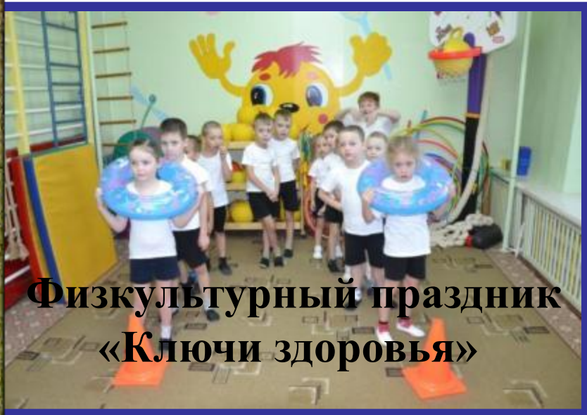
Физкультурный праздник «Ключи здоровья»

сюжетно-образовательная соревновательная игра