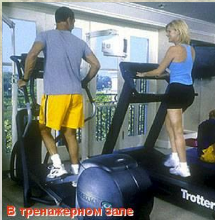
В тренажерном зале