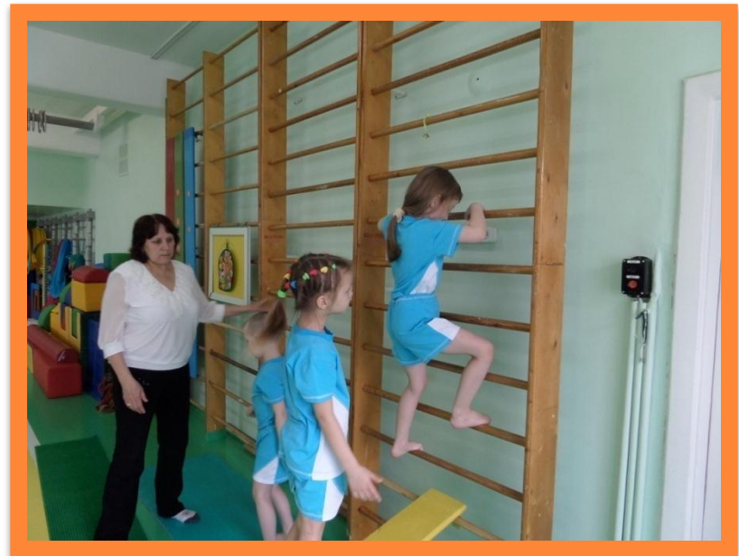
«Пожарные на учении»