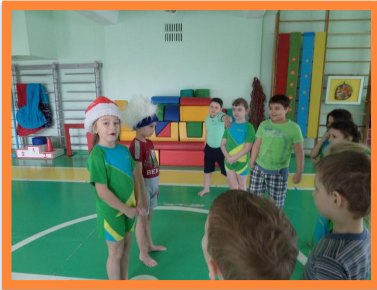
Подвижная игра «Два Мороза»