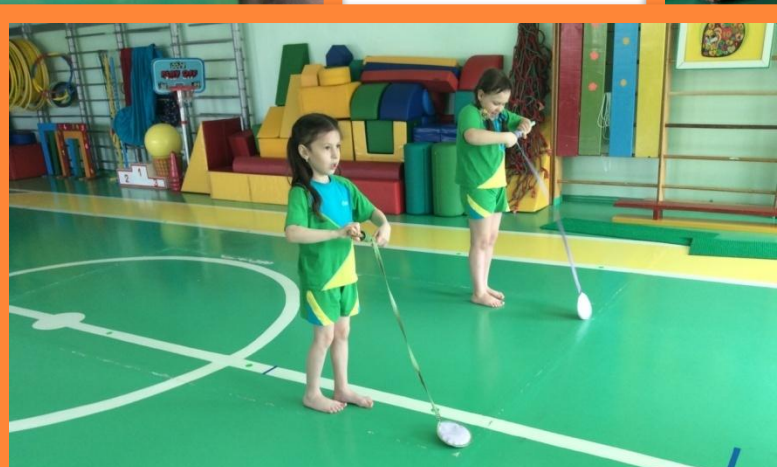
Упражнение «Поймай рыбку»