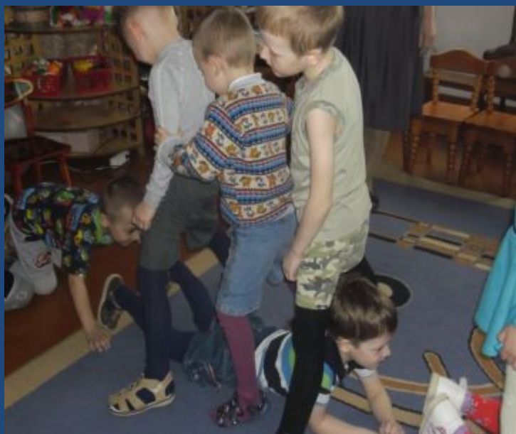
Аттракцион «Живой туннель»

Цель: воспитание интереса, гордости за свою страну, уважительное отношение ко всем, проживающим на территории страны.