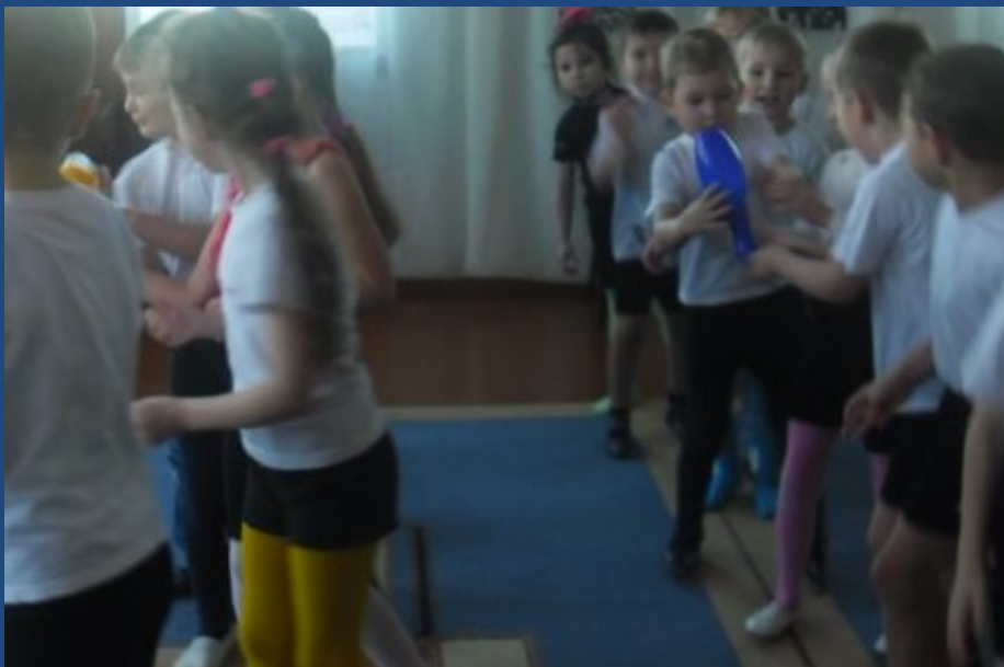
Эстафета «Передача снарядов»

Цель: заложить нравственные начала в детях через ознакомление с событиями Великой Отечественной войны, воспитывать патриотические чувства, эмоционально-положительное отношение к воинам-защитникам, желание быть такими же смелыми, ОТВАЖНЫМИ.