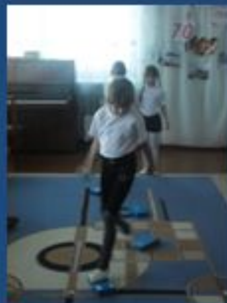
Эстафета «По мивному полю»