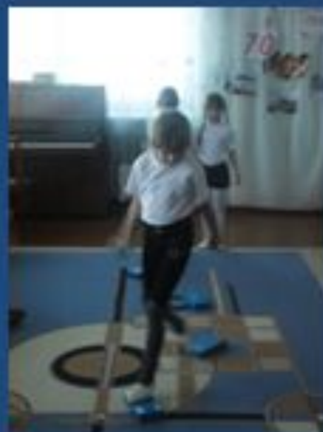
Эстафета «По мивному полю»