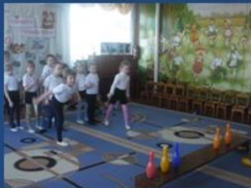
Аттракцион «Попади в цель»

Воспитание патриотизма, гордости за наших солдат.