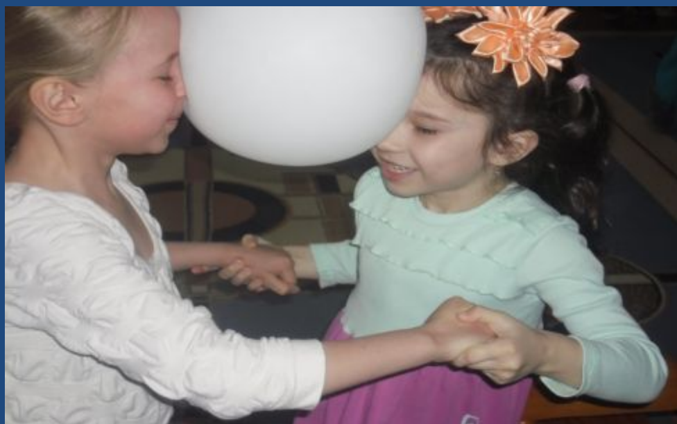
Эстафета «Вместе – мы сила»