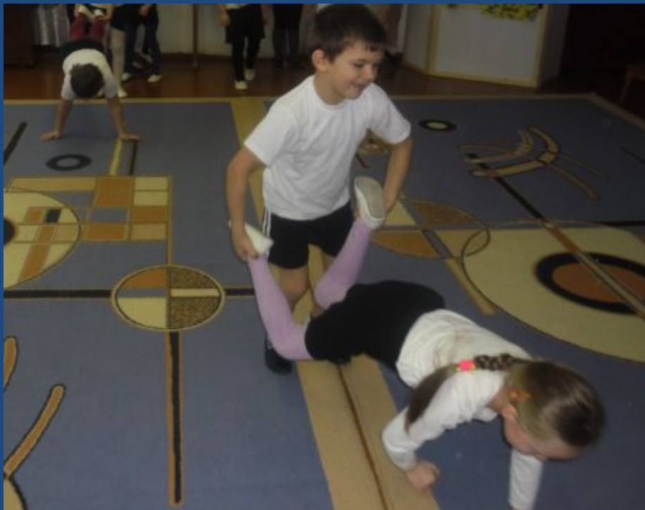
Аттракцион «Тараканьи бега»

Цель: расширять представления детей об уральских забавах.