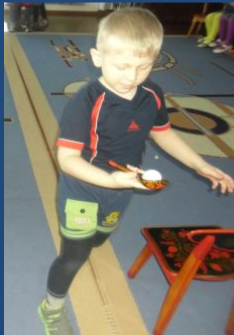
Эстафета «Не урони»