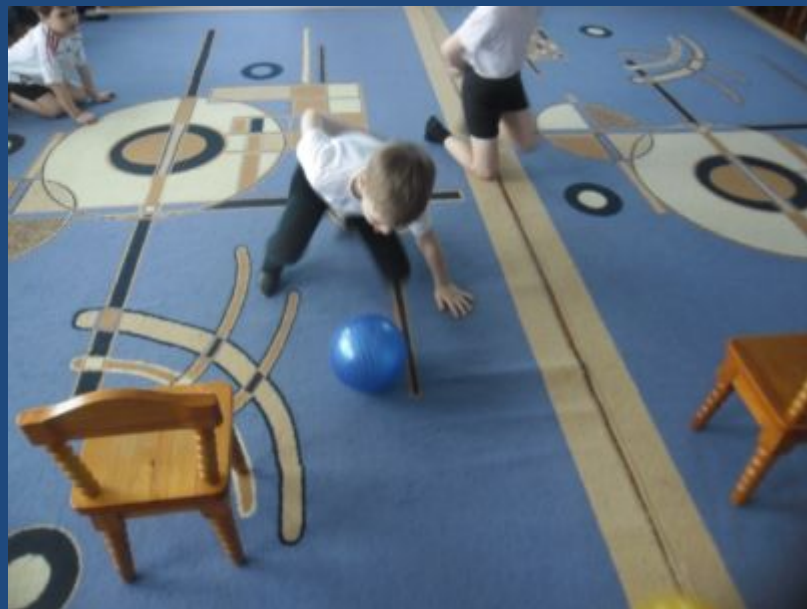
Эстафета «Выполнить задание любой ценой»