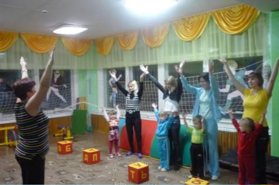
“Физкультура с мамой”