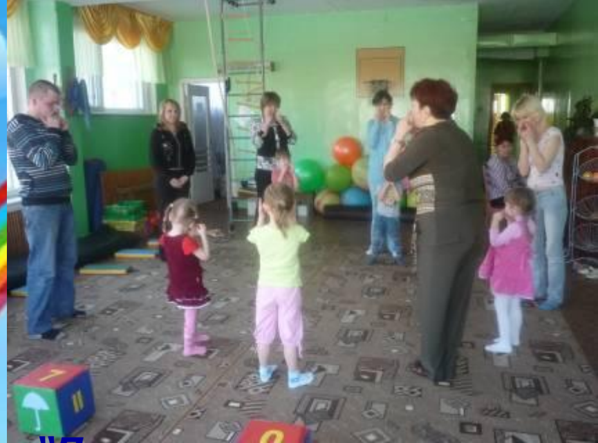
“Путешествие в страну здоровья”