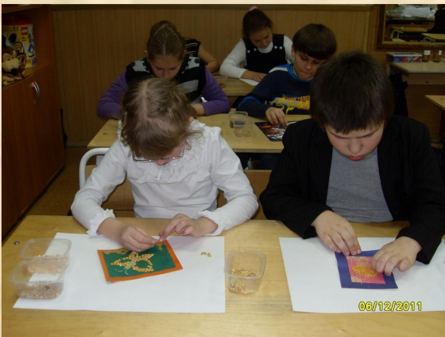
Кружок «Умелые ручки»