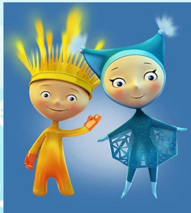
Лучик и Снежинка