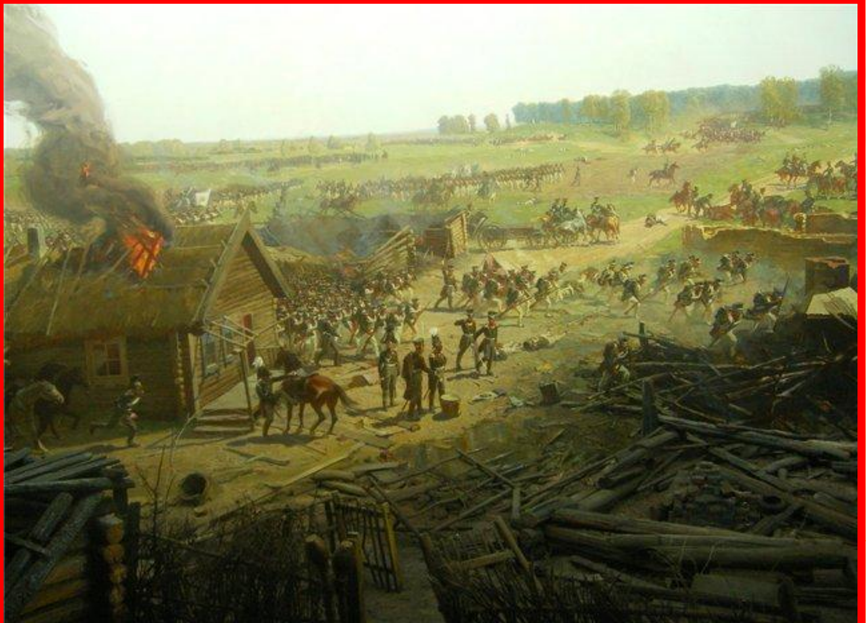
Панорама битвы под селом Бородино