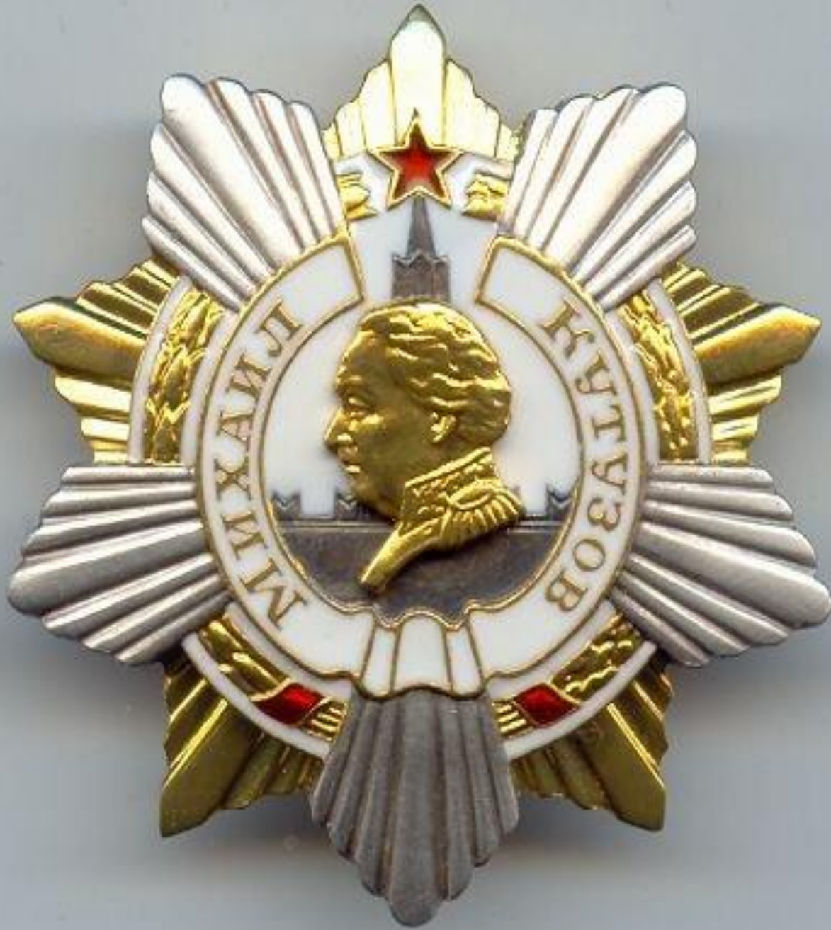
Орден имени М.И.Кутузова