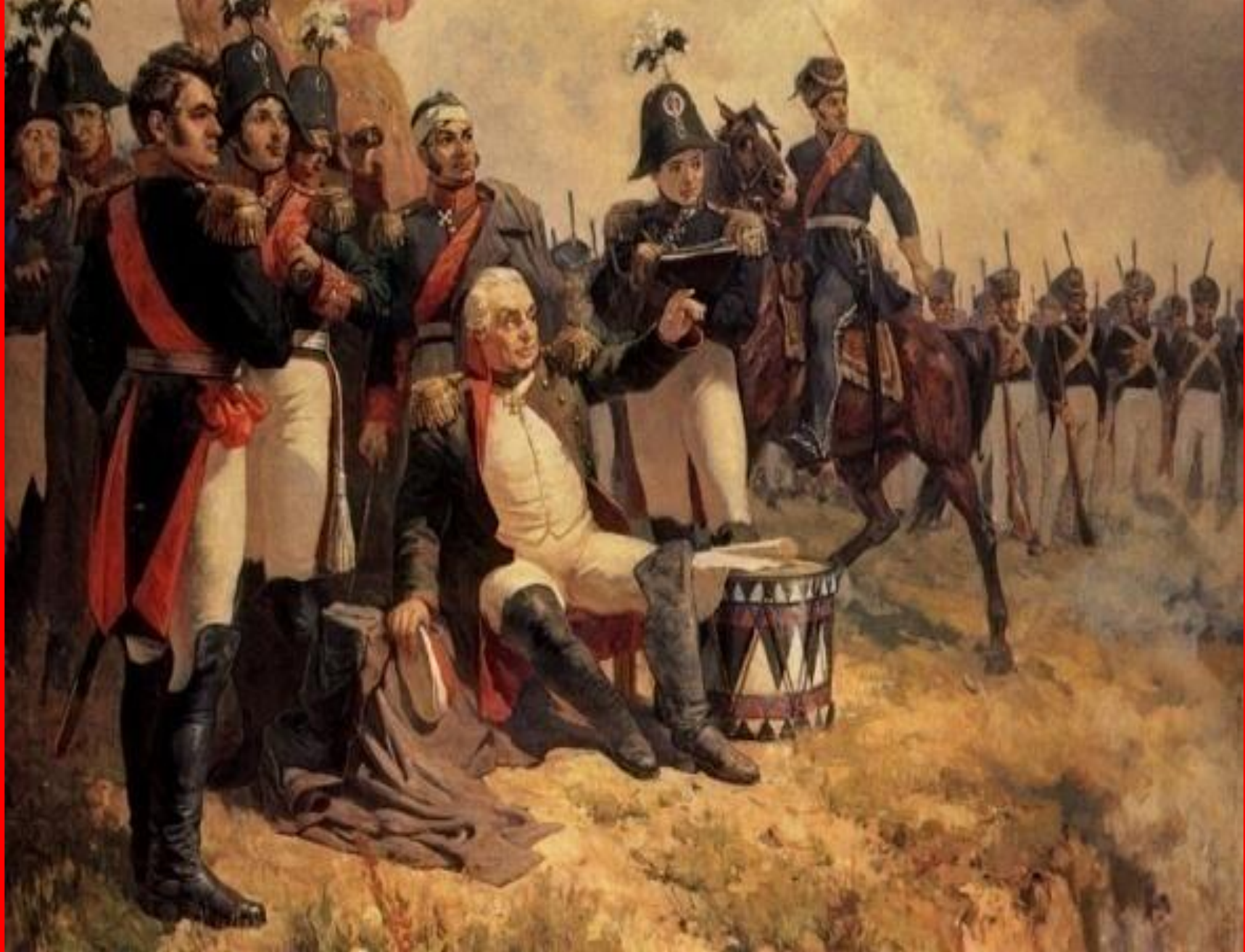
Дальнейший план боя- решение генералов и главнокомандующего