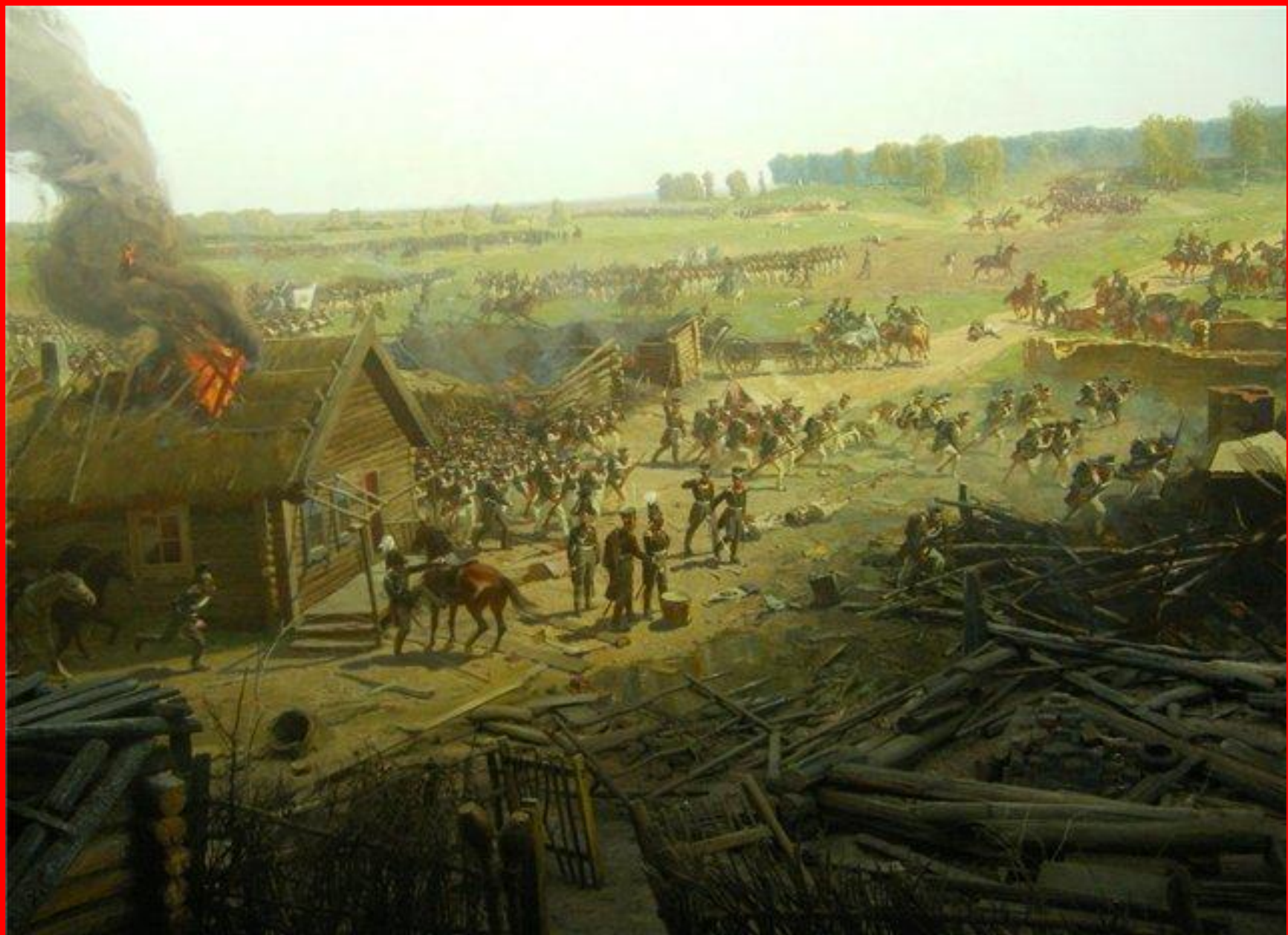
Панорама битвы под селом Бородино