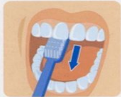
3. Внутренние поверхности передних зубов