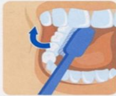
2. Внутренние поверхности зубов