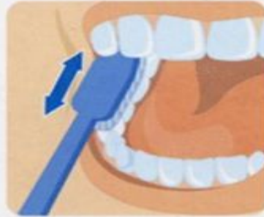
4. Жевательная поверхность зубов