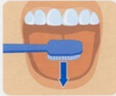
6. Чистка языка