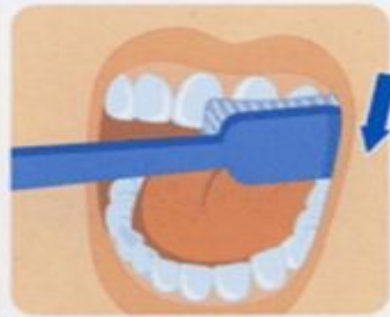
1. Наружные поверхности зубов