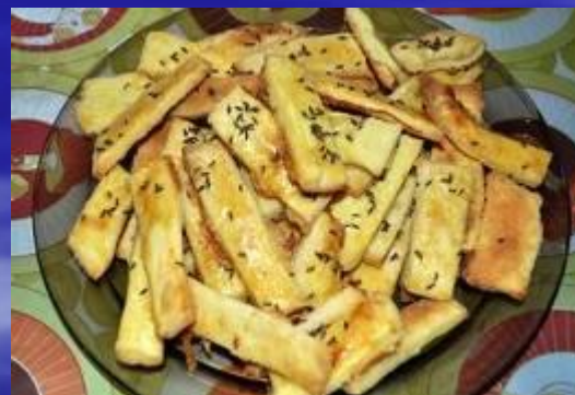
Финское солёное печенье