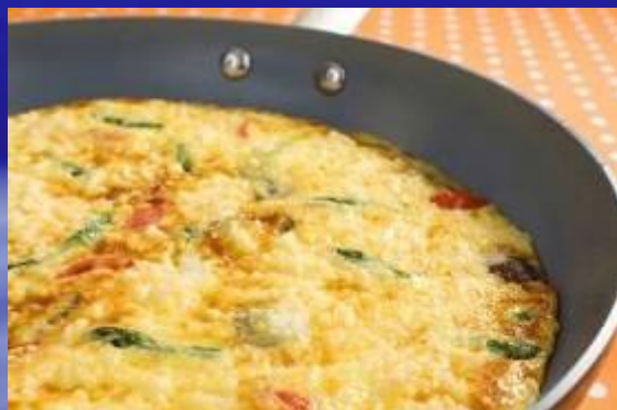
Экреоря - яичница по-фински