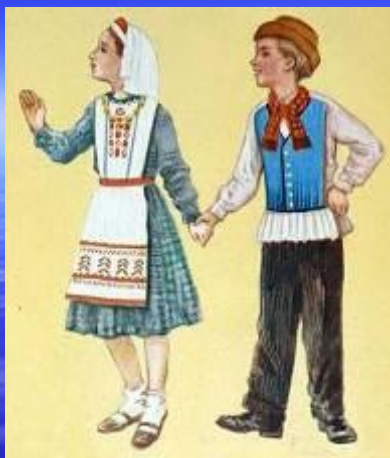
Костюмы для детей