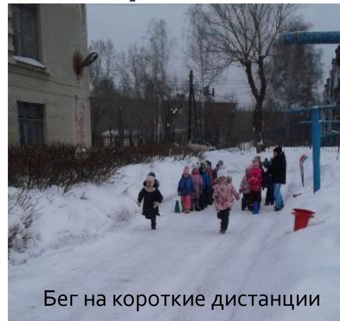
Бег на короткие дистанции