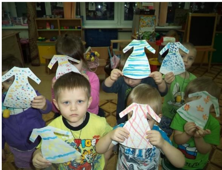
Фото 29. Рисование: «Платье для девочки».