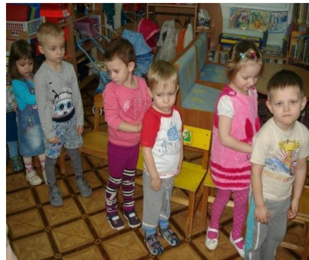
Фото 10. ФЭМП: д/у «Кто выше?»