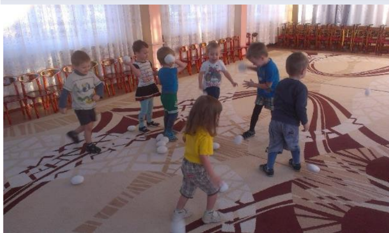
Фото 35. подвижная игра: «Снежки».