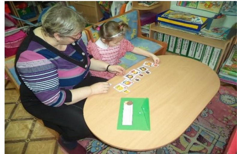
Фото 28. д/и «Найди вторую»