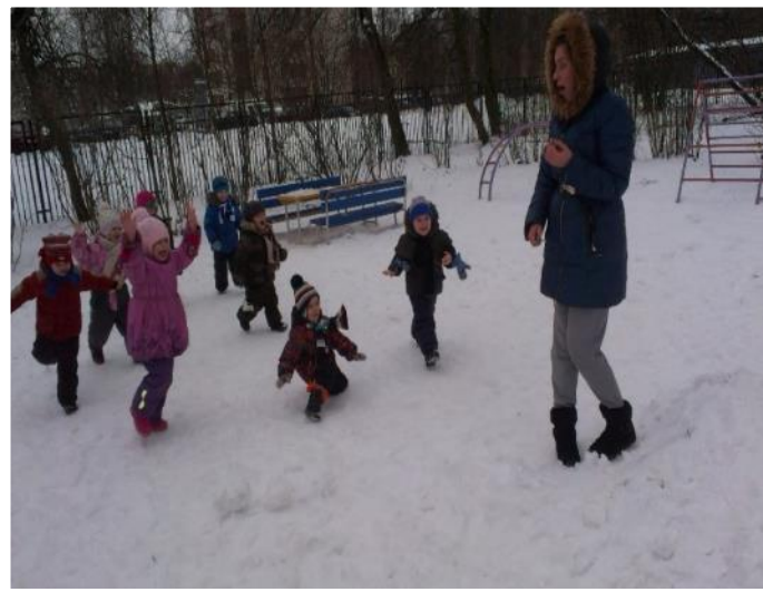
Фото 38. п/и «Замри»