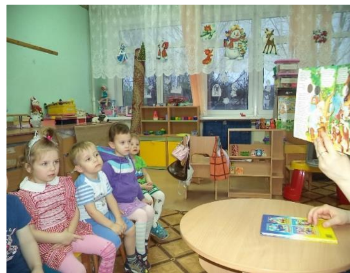
Фото 22. Восприятие худ. текста: «Айболит».