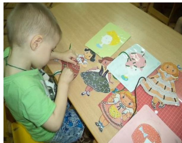
Фото 20. Игры-шнуровки.