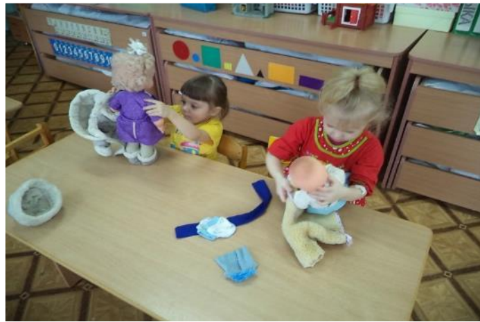
Фото 27. игровое упражнение: «Одень куклу на прогулку»