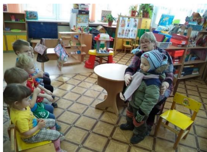
Фото 2. д/у «Одежда на прогулку»