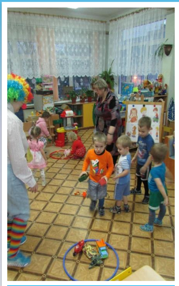
Фото 41. п/и «Собери игрушки».