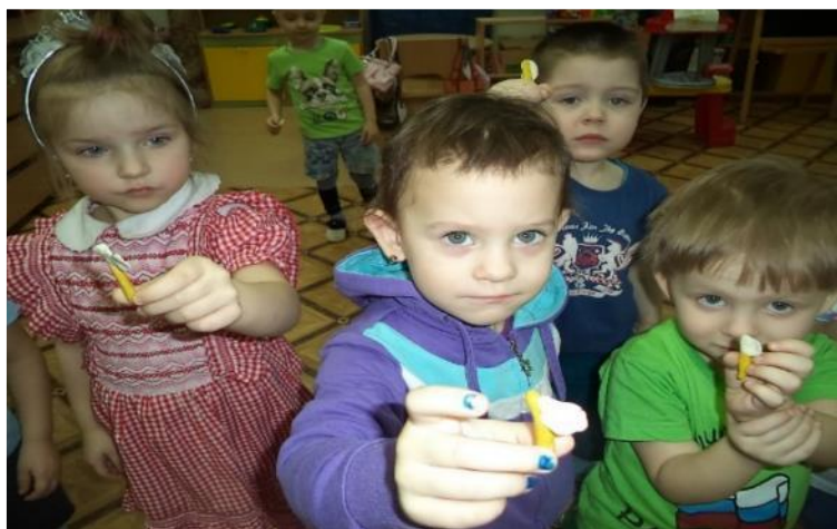
Фото 31. Лепка: «Зубная»