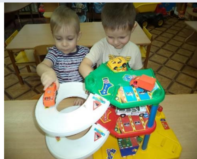
Фото IV. С/р игра: «Барашки».