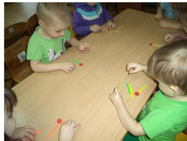
Фото 14. Конструирование: «Забавные человечки».