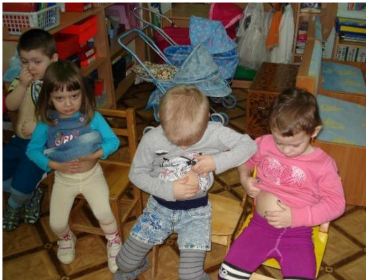
Фото 1. Беседа: «Знакомство со строением тела».