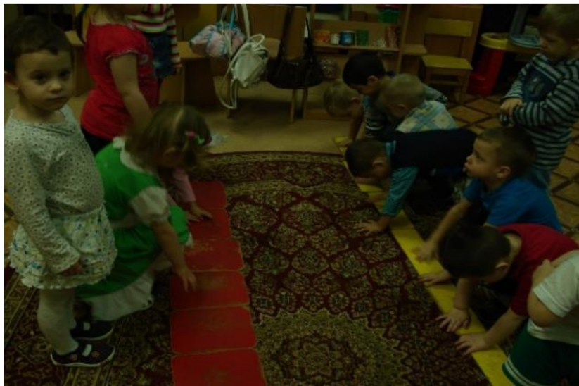
Фото 9. ФЭМП: закрепл. понятий «широкий-узкий»