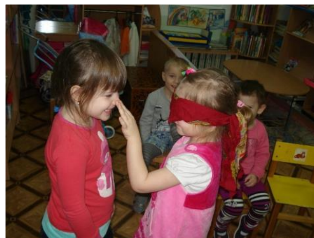
Фото 16. и.м.п.