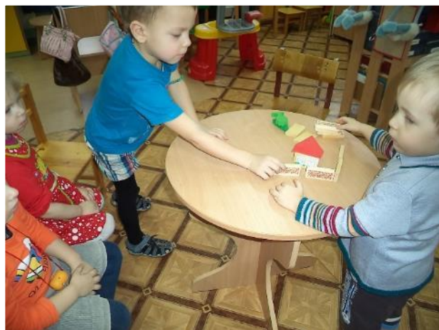
Фото 15. Конструирование