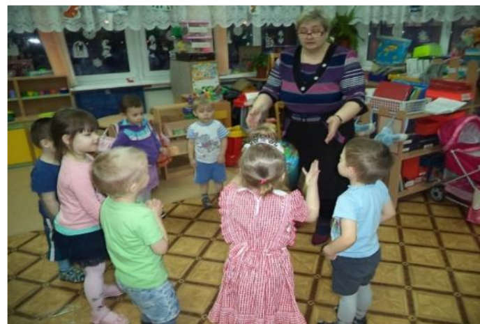
Фото 18. сл. игра: «Ты – моя частичка».