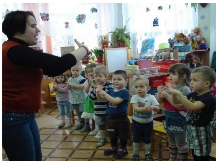
Фото 17. п/г «Умывалочка».