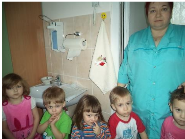
Фото 13. Экскурсия в мед. кабинет.