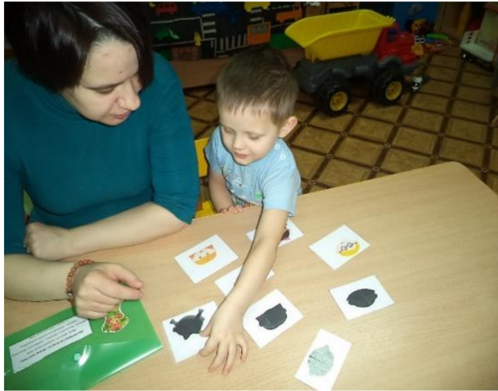
Фото 25. д/и «Найди тень».