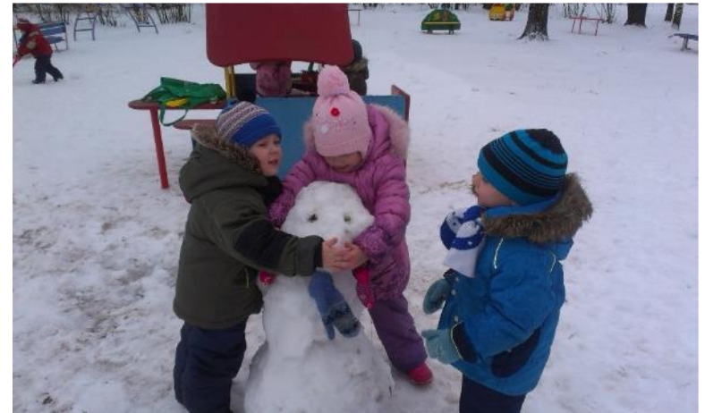
Фото 6. Совместная деятельность: «Лепим снеговика».