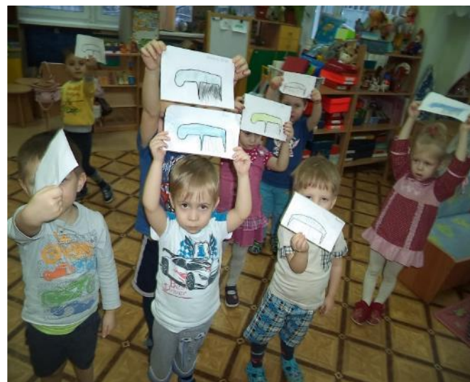
Фото 32. Рисование: