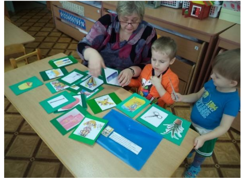
Фото 26. д/и «Подбери картинки».