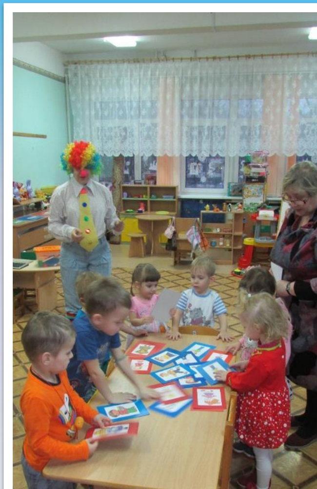
Фото 42. д/и Нади девочку и мальчика».