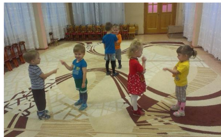
Фото 34. Танец «Дружные ребята».