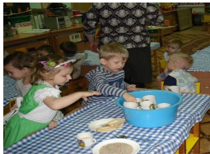
Фото 3. Бытовой труд: