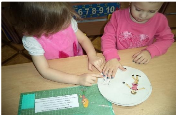
Фото 19. д/и «Назови части тела».