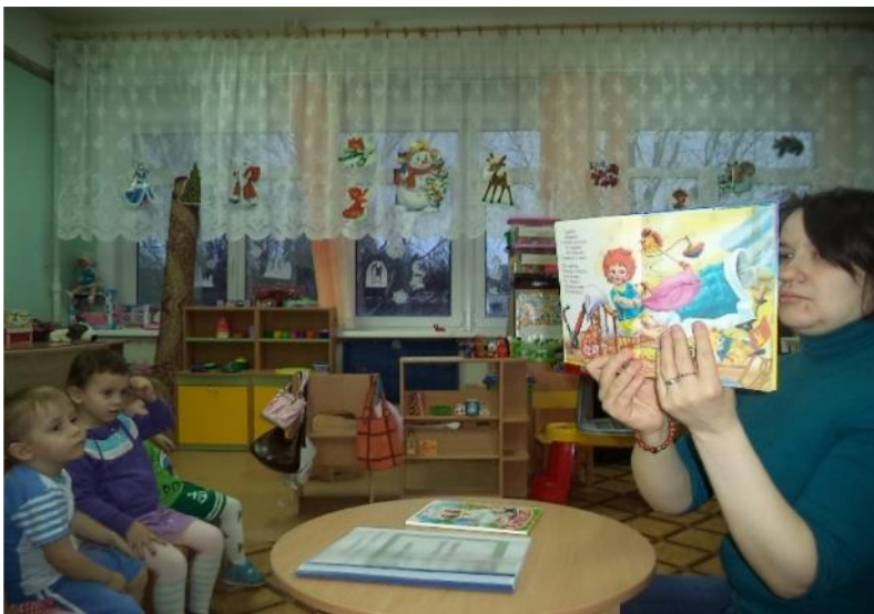
Фото 21. Восприятие худ. текста: «Мойдодыр».