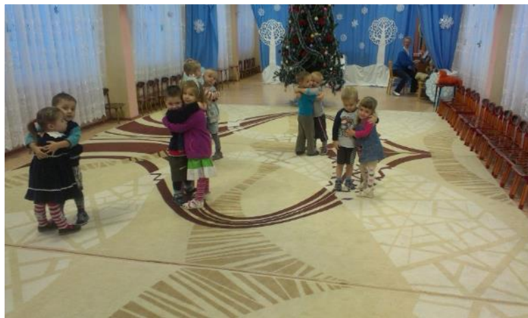
Фото 33. Танец: «Поссорились- помирились»