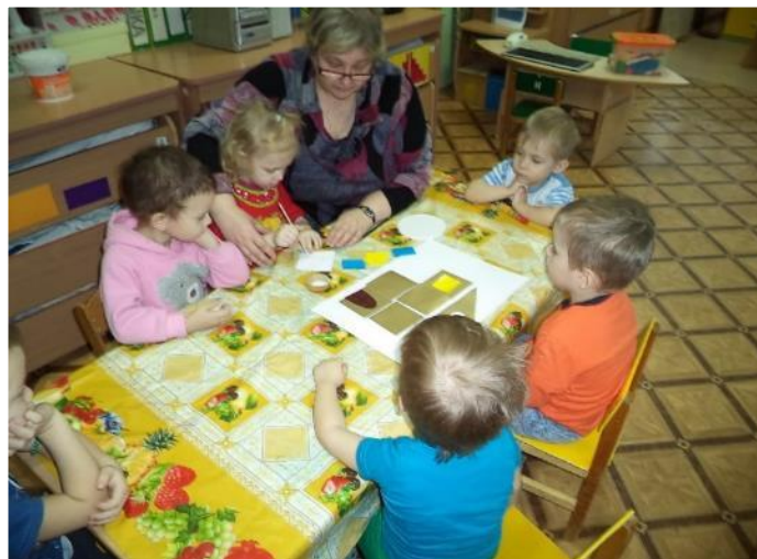
Фото 30. Аппликация: «Детская больница»