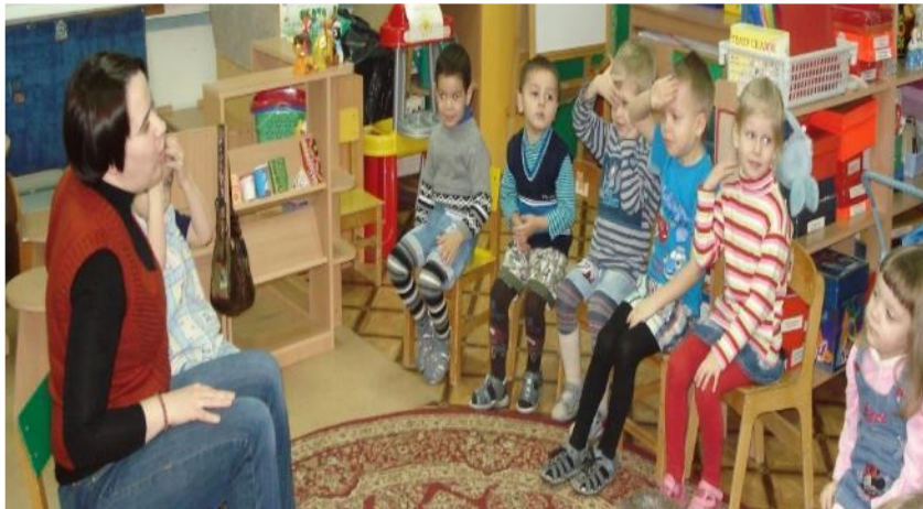
Фото 5 . Пальчиковая игра: «Это я».