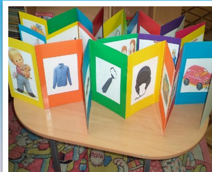
Фото VI. Ширмы