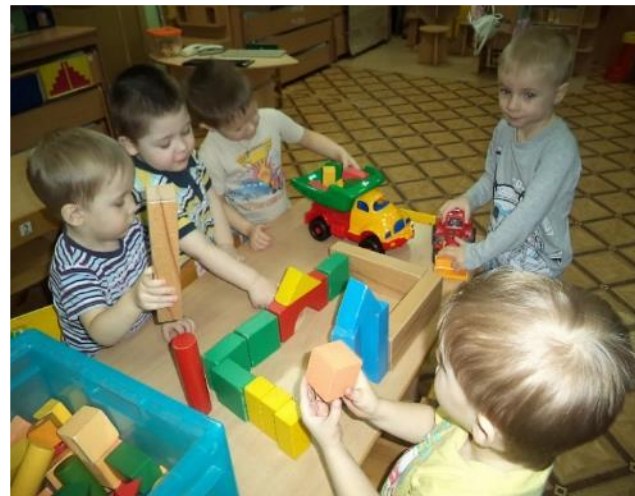
Фото II. Конструирование: «Детский городок».