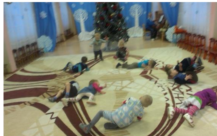
Фото 36. муз. игра «Саночки».