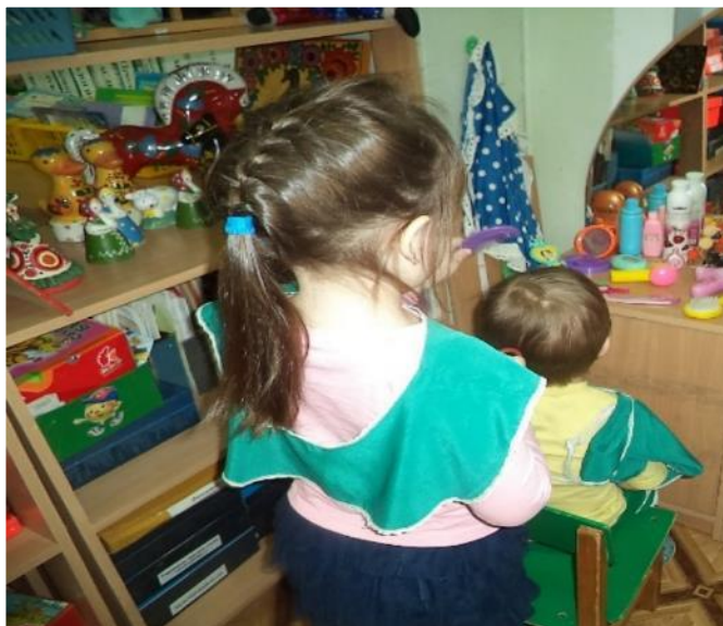
Фото III. С/р игра: