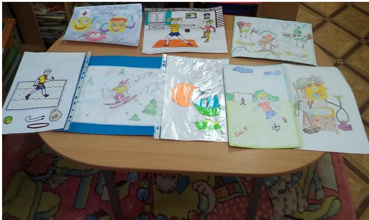
Фото 43 . Совместная деятельность родителей и детей группы.