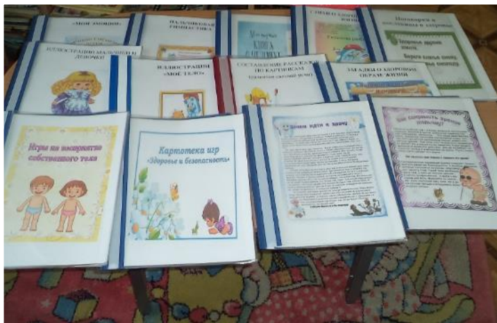
Фото VII. Дидактические материалы