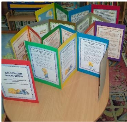
Фото V. Папки-передвижки