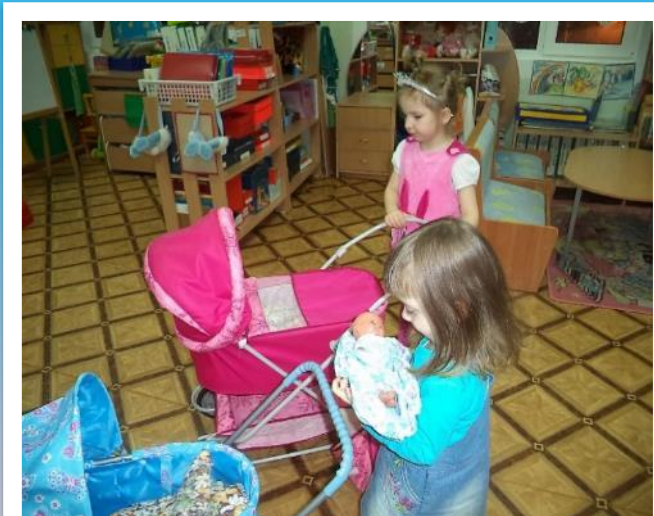
Фото I. С/р игра: «Семья».