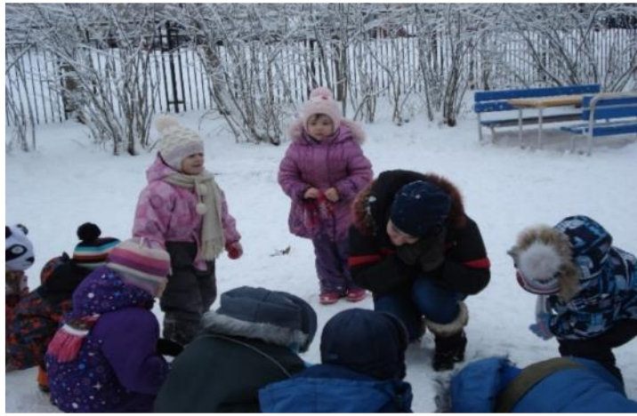
Фото 37. п/и «Повтори за мной»