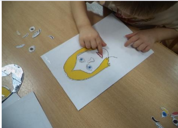
Фото 7. д/и «Фоторобот».