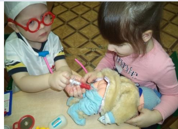
Фото 8. с/р игра «Кукла