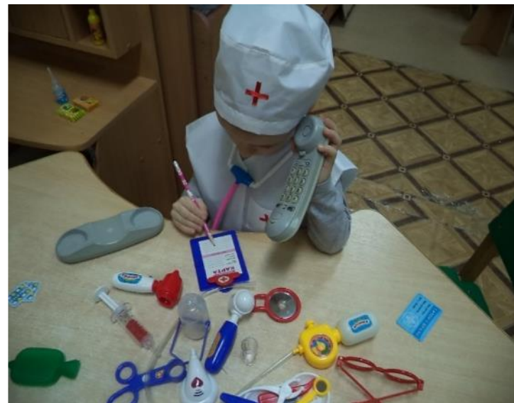
Фото 4. с/р игра