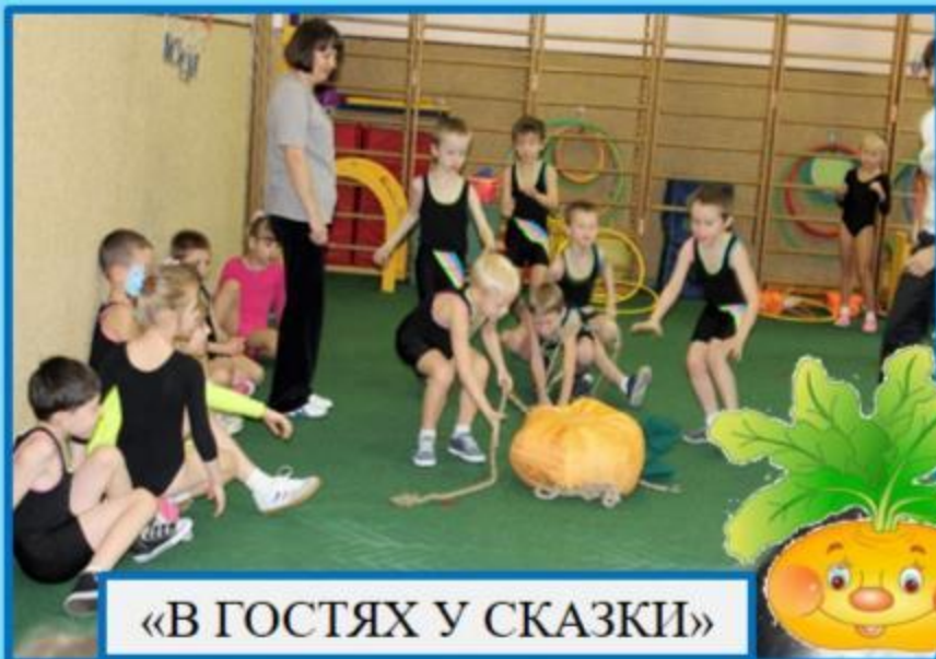
«В ГОСТЯХ У СКАЗКИ»