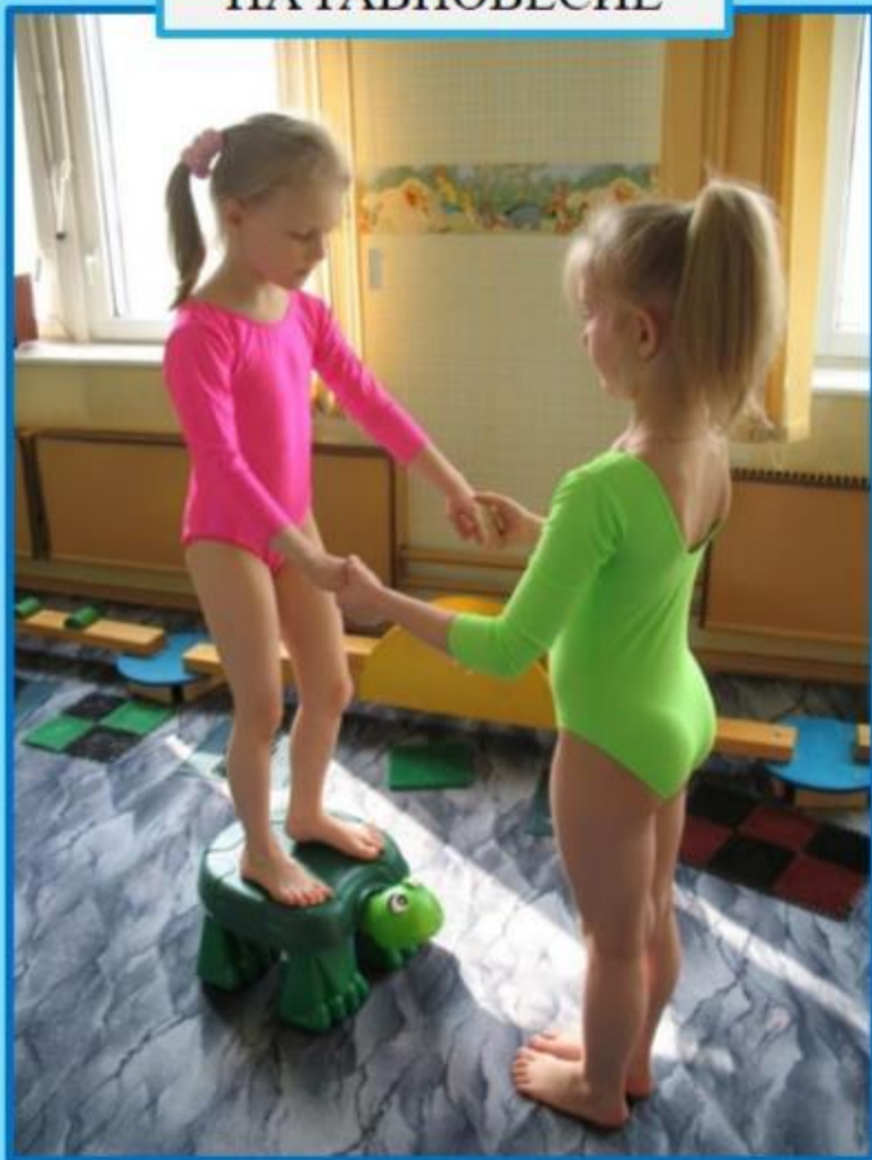
УПРАЖНЕНИЕ НА РАВНОВЕСИЕ