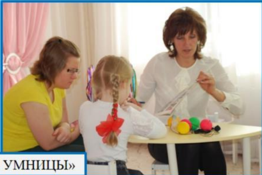
«УМНИКИ И УМНИЦЫ»