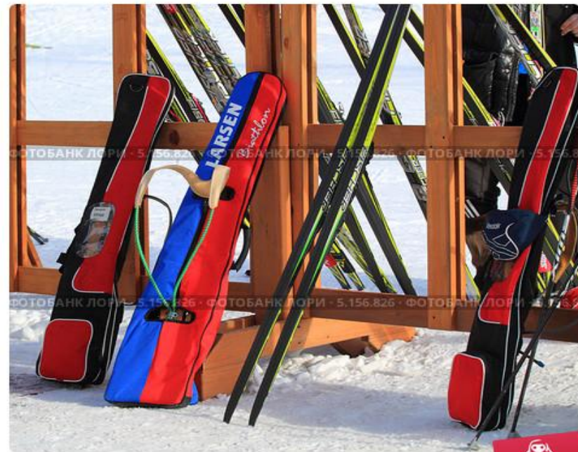
Чехлы с ружьями и лыжи. Биатлон

Винтовка к месту стрельбы и обратно, должна переноситься в зачехленном виде. Чехол для винтовки должен иметь отверстие размером 15х15 см., через которое должен хорошо просматриваться затвор винтовки.