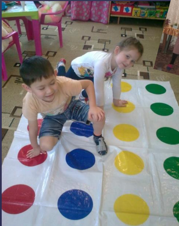
▣ Игра «Мистер Твистер»