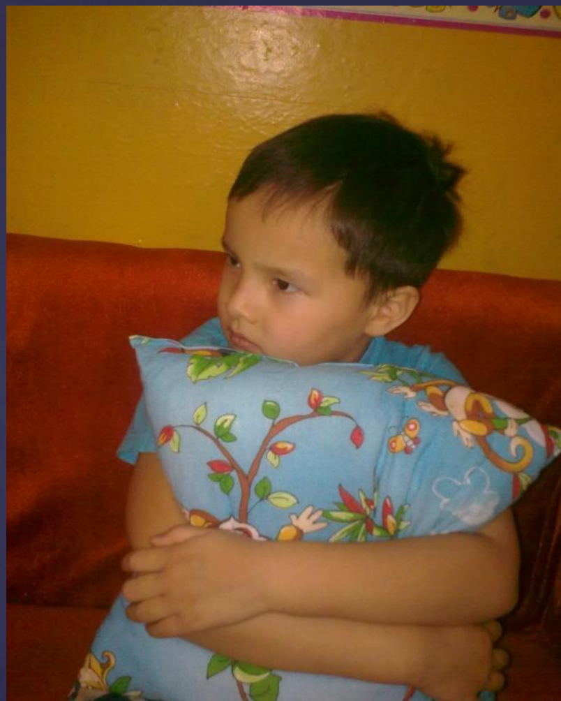
«Подушки –поплакушки» (подушки для битъя)