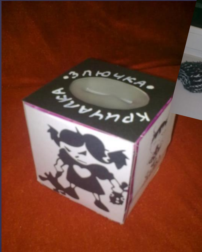
▣ Коробочка «Злючка-Кричалка»