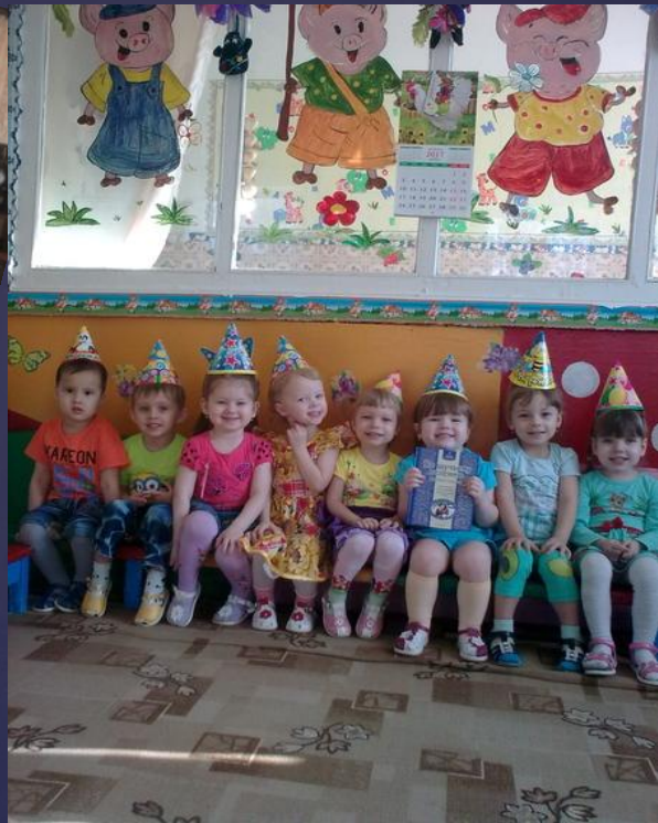
▣ Маски. Праздничные колпачки