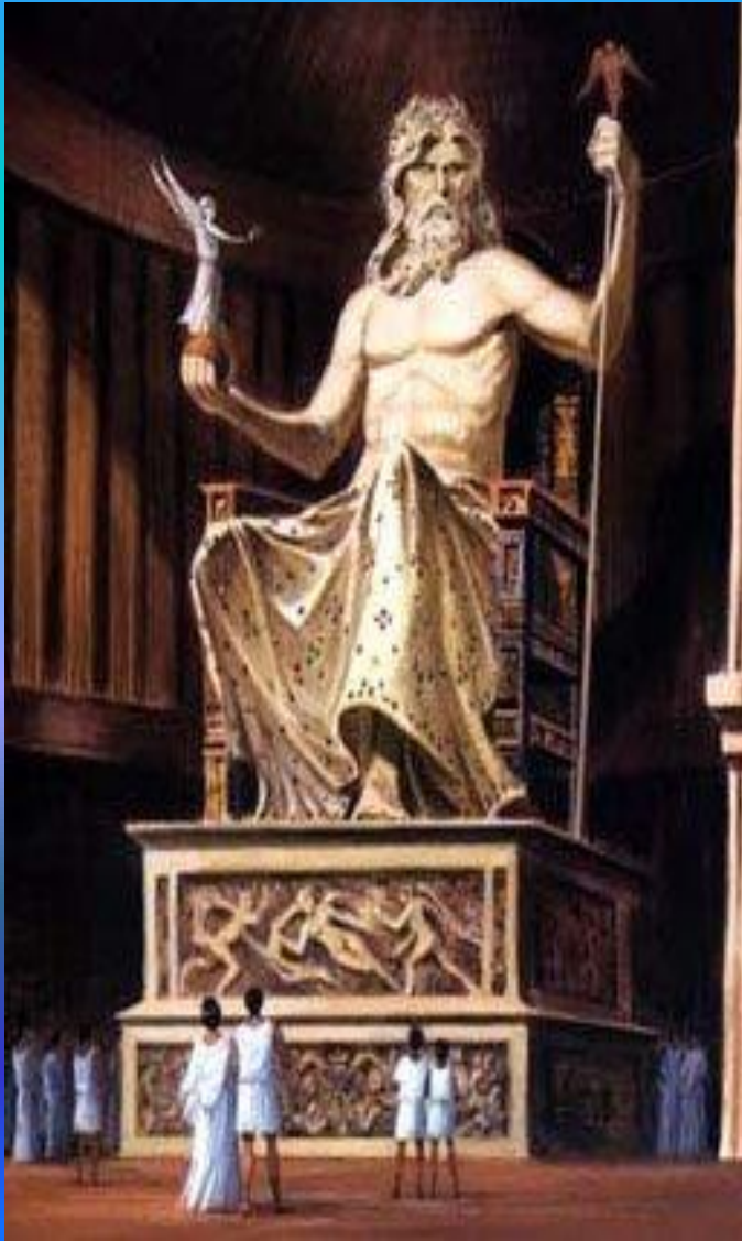
Статуя Зевса в Олимпии - одно из Семи чудес света.