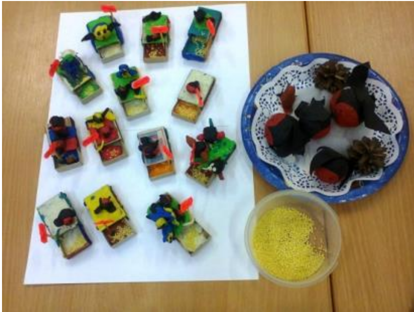
Лепка «Птицы на кормушке»