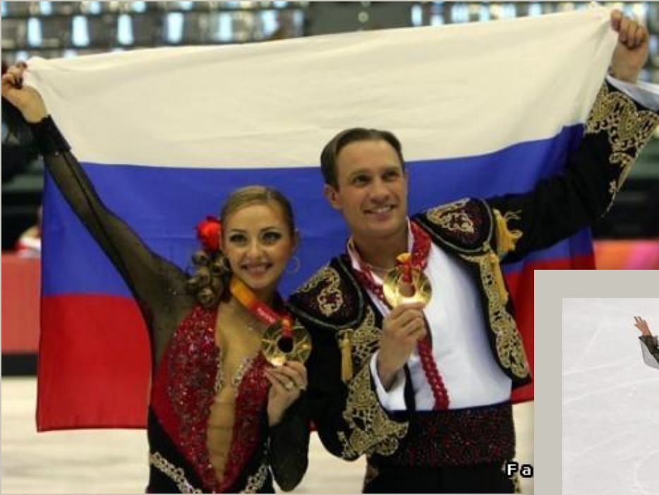
Татьяна Навка и Роман Костомаров