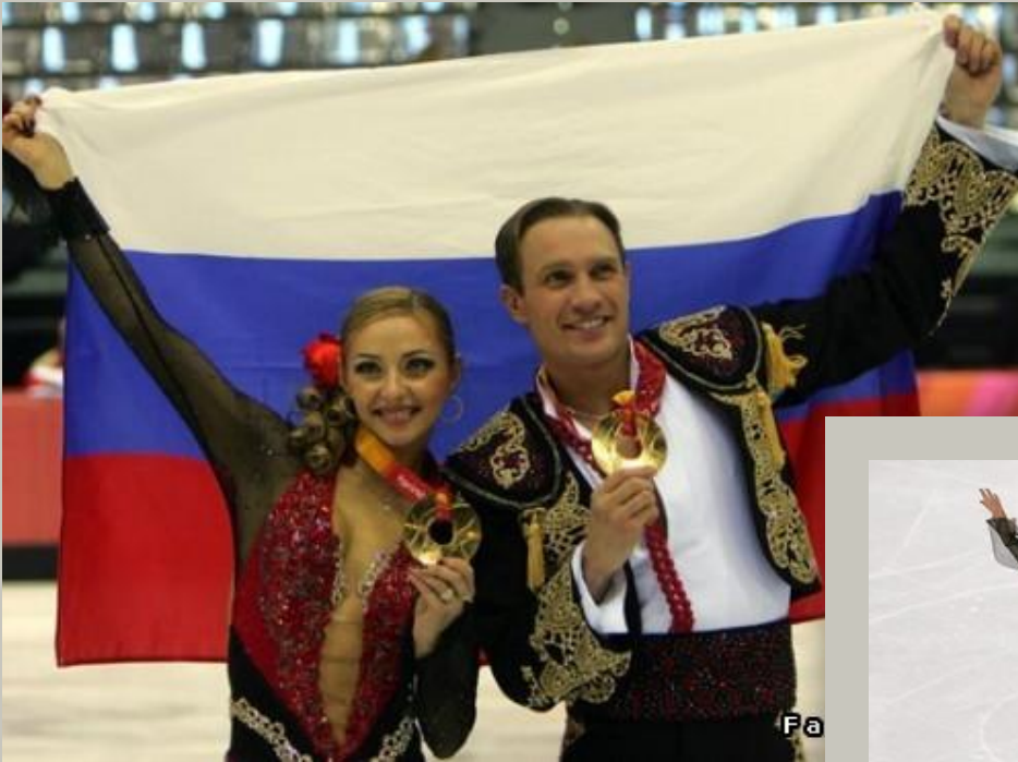
Татьяна Навка и Роман Костомаров