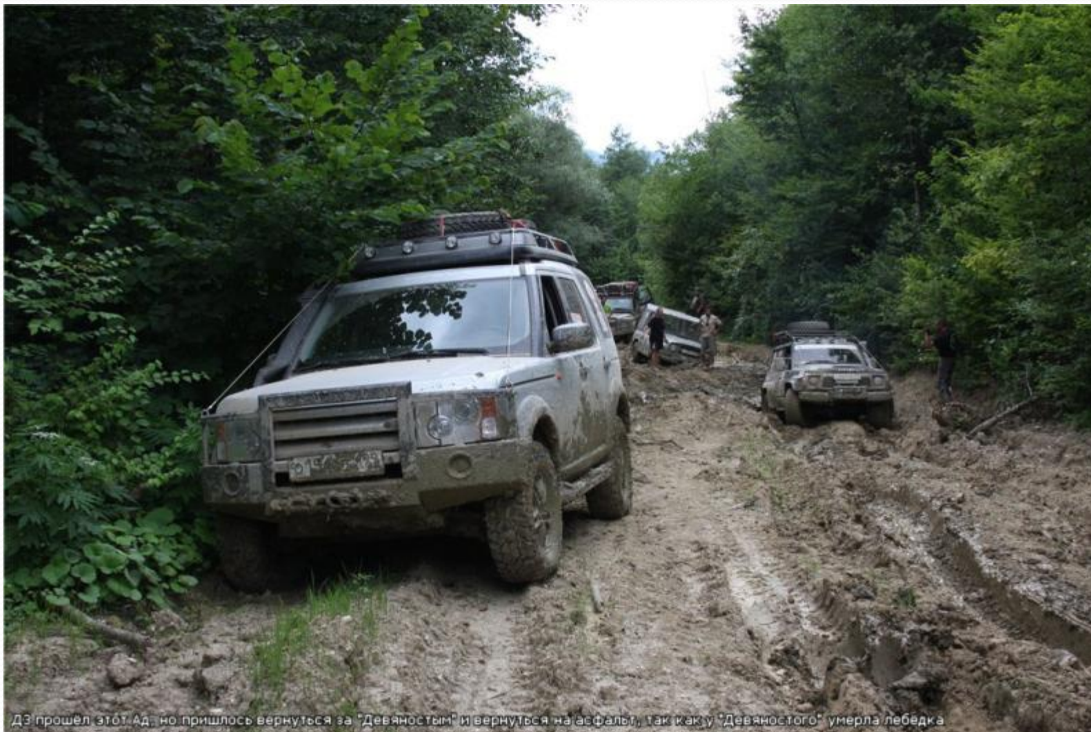
ДЗ прошел этот Ад, но пришлось вернуться за "Девяностым" и вернуться на асфальт, так как у "Девяностого" умерла лебедка