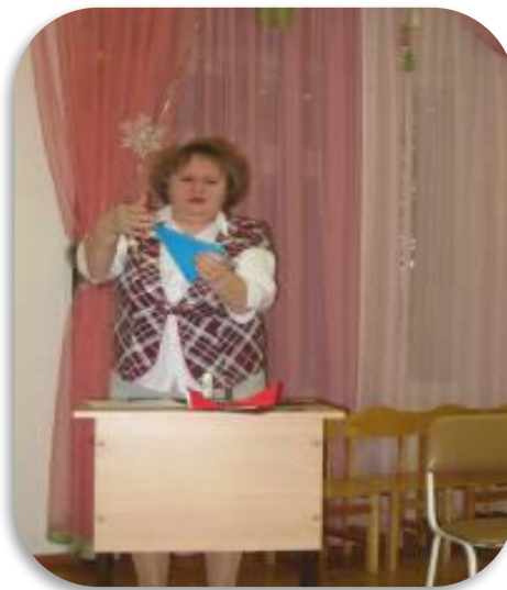
Мастер-класс «Роль оригами в развитии мелкой моторики руки»