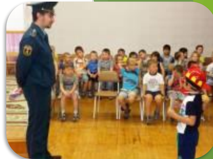
Встреча с сотрудниками ГИБДД и МЧС