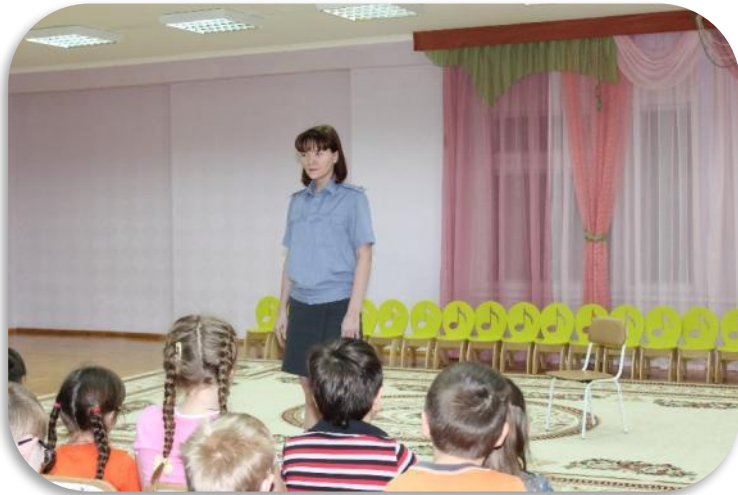
Встреча с медицинским работником