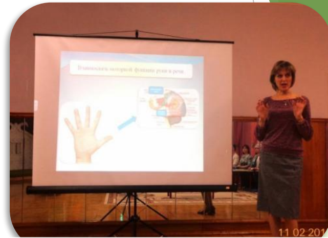
Выступление учителя-логопеда по теме «Развиваем речь, играя»