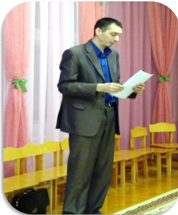
Встреча с юристом.