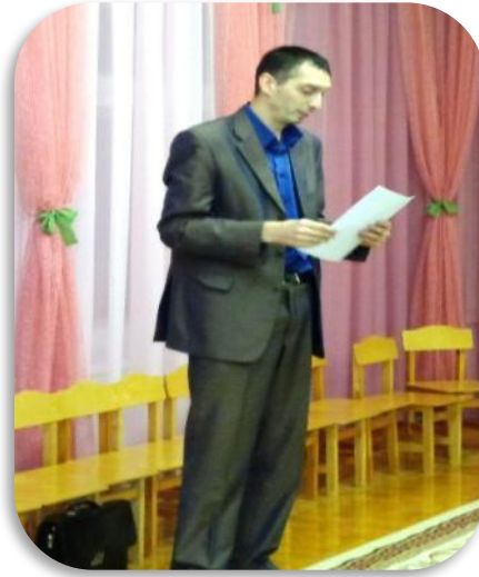
Встреча с юристом. Интеллектуальная игра «Право имею!»