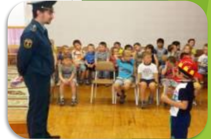
Встреча с сотрудниками ГИБДД и МЧС