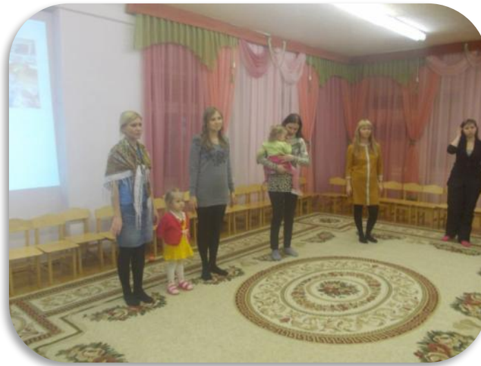
Совместные праздники и развлечения