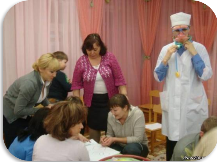
Встреча с медицинским работником. Командная игра «За здоровьем в детский сад!»