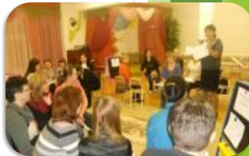
Акции и проекты