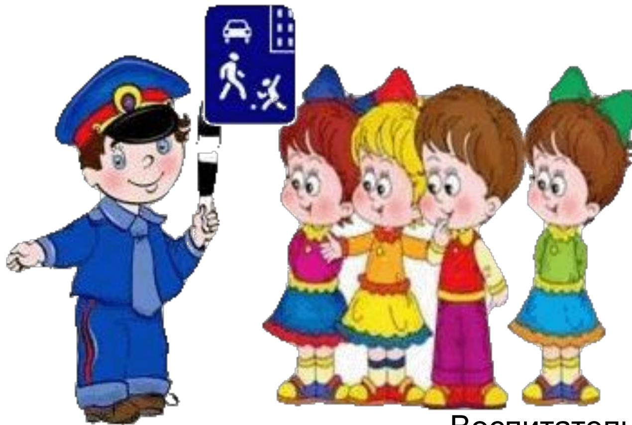
Воспитатель средней группы Генглик Н.Э.