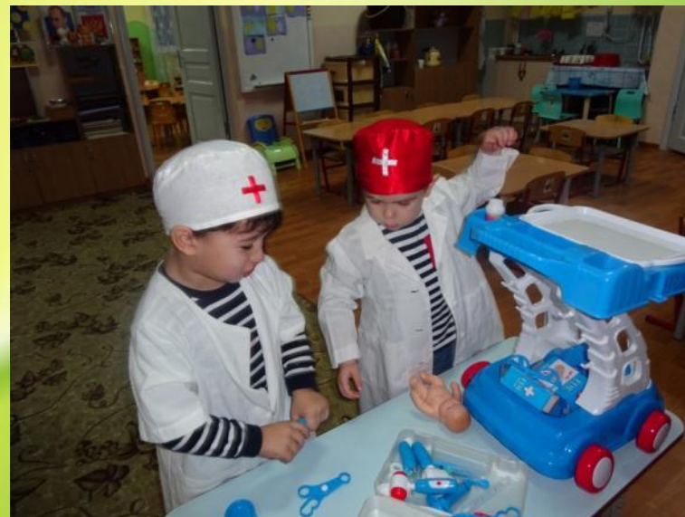
С/р игра «Скорая помощь»