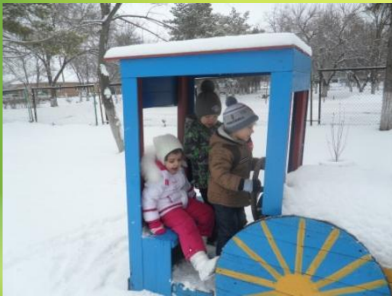
С/р игра «Путешествие»