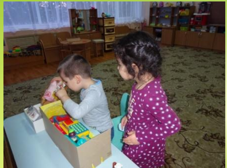
С/р игра «Магазин «Полезные продукты»»