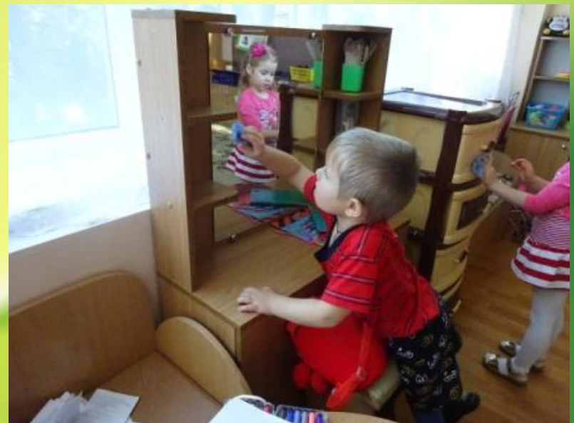
Чистота –залог здоровья!