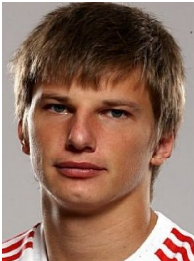
АНДРЕЙ АРШАВИН ФУТБОЛИСТ