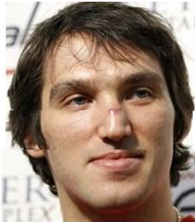
АЛЕКСАНДР ОВЕЧКИН ХОККЕИСТ