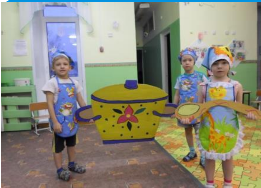
А вот и наша кастрюля!