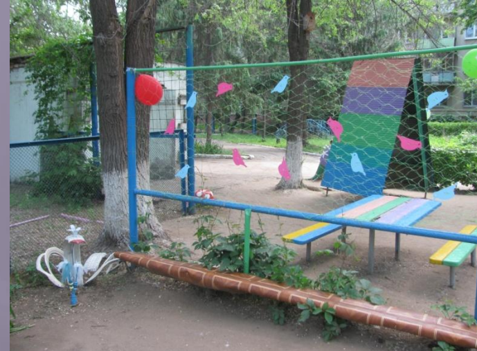
Автомобиль «Царевна Лебедь»