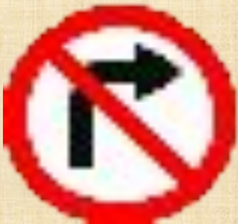
Поворот направо запрещен