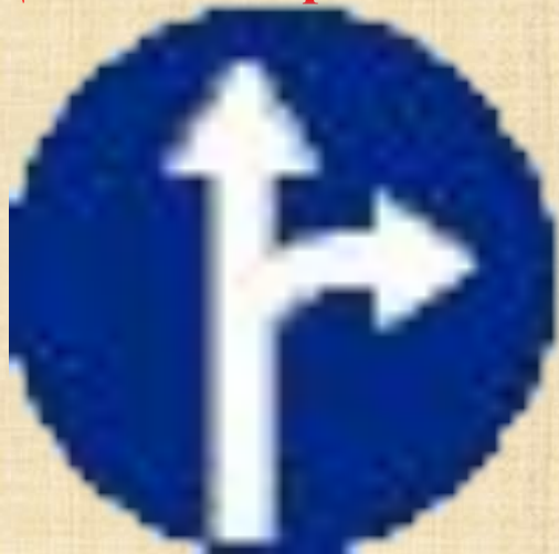
Движение прямо или направо