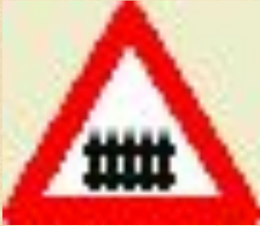
Железнодорожный переезд со шлагбаумом