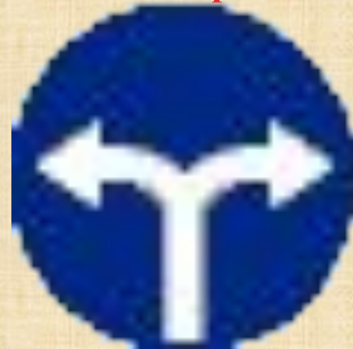
Движение направо или налево