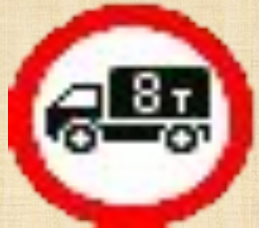
Движение грузовых автомобилей