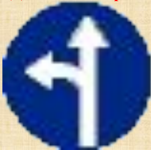
Движение прямо или налево