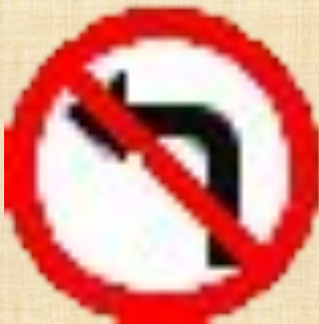
Поворот налево запрещен