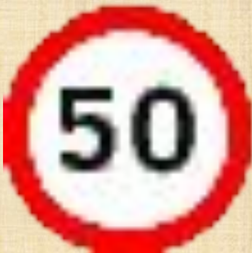
Ограничение максимальной скорости