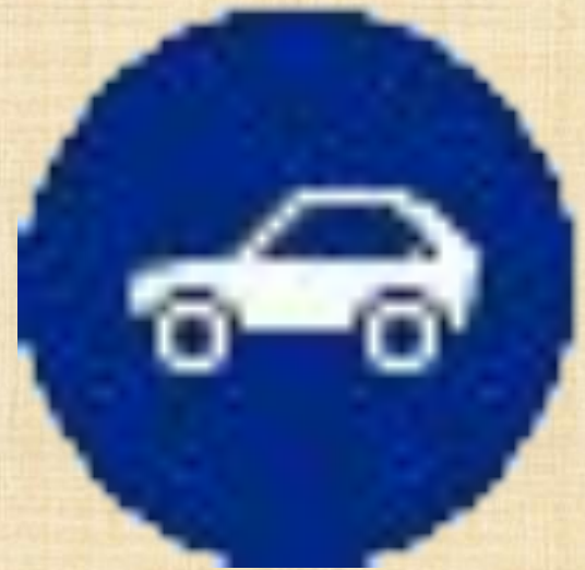
Движение легковых автомобилей