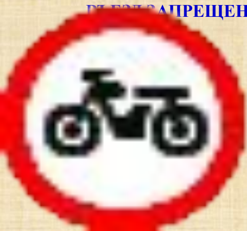
Движение мотоциклов запрещено