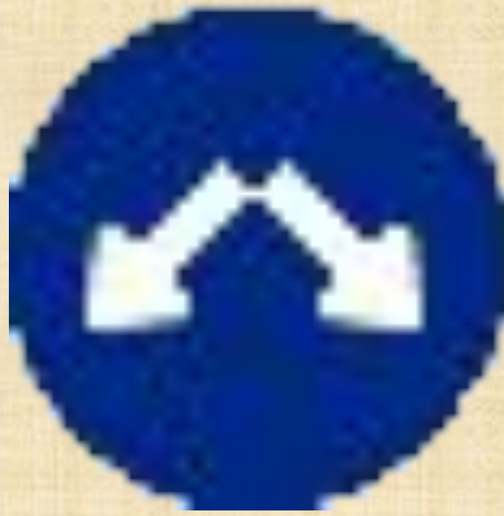
Объезд препятствия справа или слева