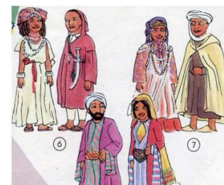
КОСТЮМЫ НАРОДОВ СЕВЕРНОЙ АФРИКИ