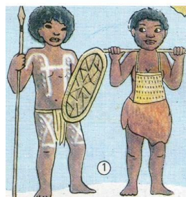
ОДЕЖДА АБОРИГЕНОВ АВСТРАЛИИ