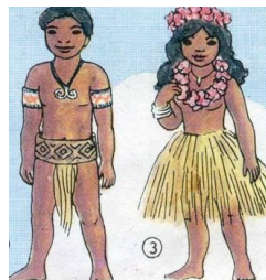
ОДЕЖДА НАРОДОВ ОКЕАНИИ