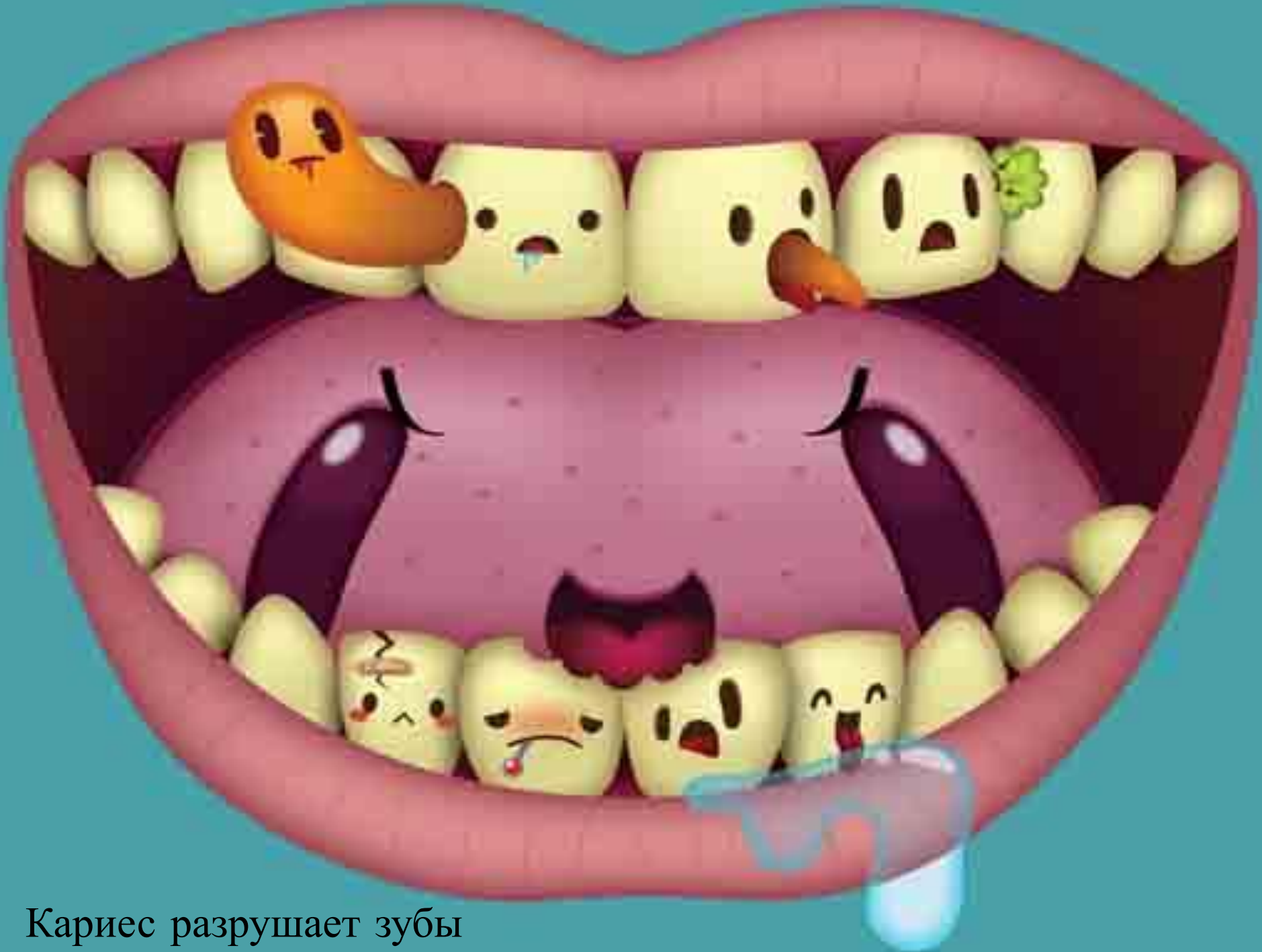
Кариес разрушает зубы