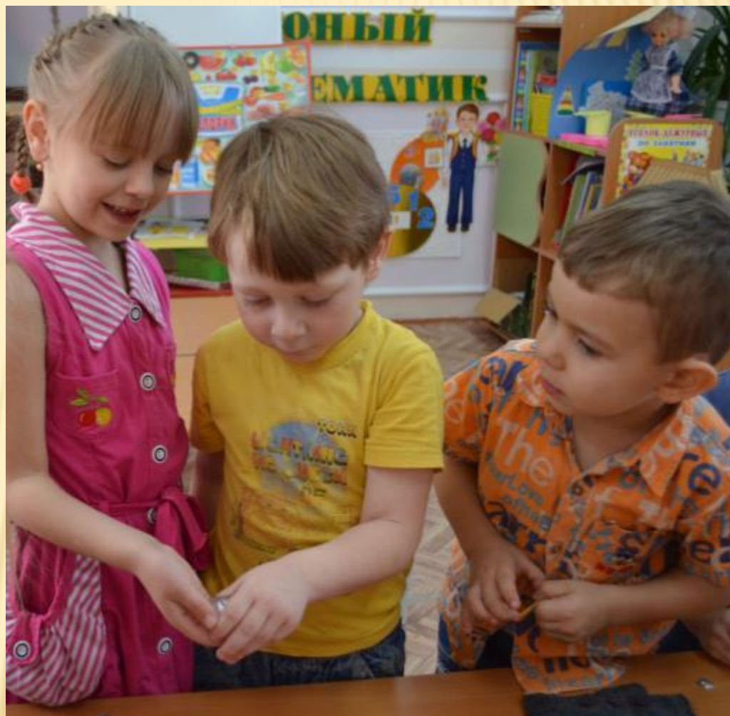
ИГРА «ЛЬДИНКА – ПУТЕШЕСТВЕННИЦА»