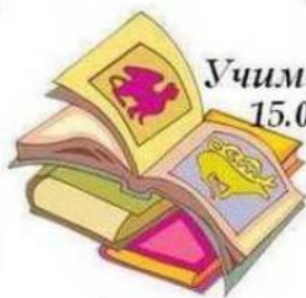
Учим уроки 15.00-17.00