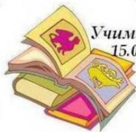
Учим уроки 15.00-17.00