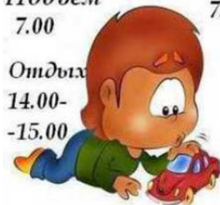
Отдых 14.00- -15.00