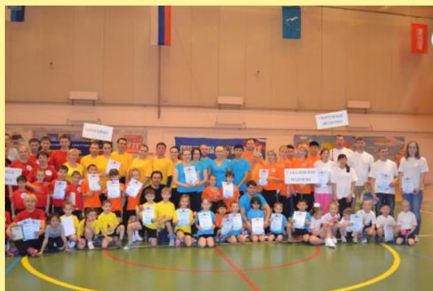
«Папа, мама, я — спортивная семья!»