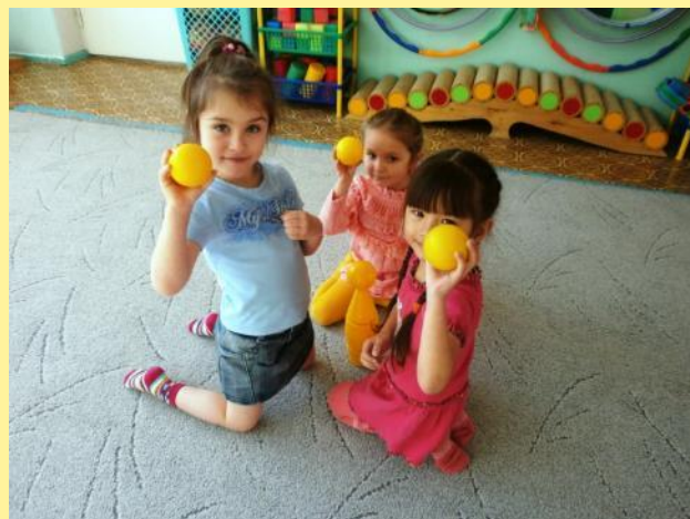
«Найди свой цвет»