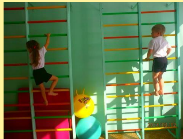
«Пожарные на ученье»