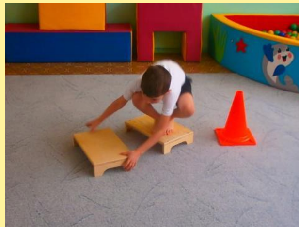
«Степ - платформа»