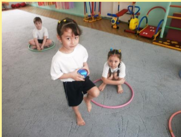
«Охотник и зайцы»