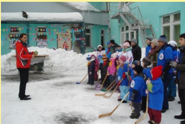
«Хоккей в валенках»