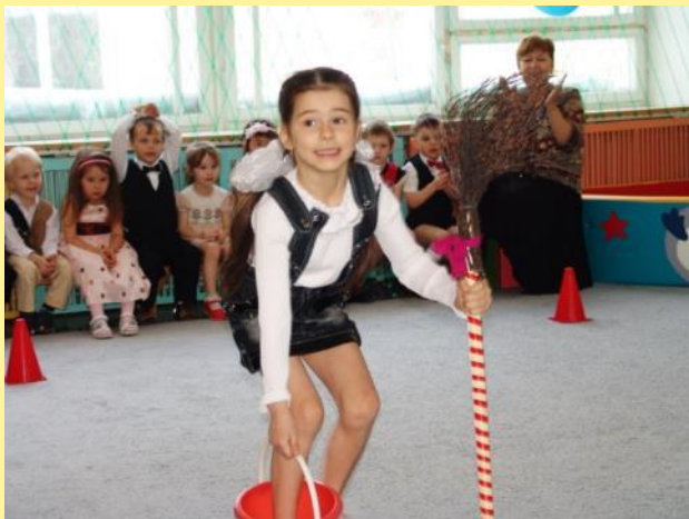
«Баба - Яга»