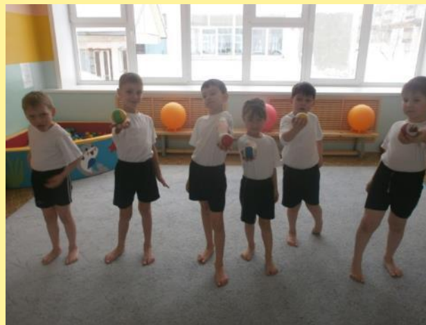
«Мячи разные несем»