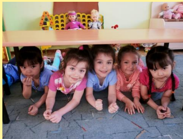
«Детки в домике сидят и в окошечко глядят»