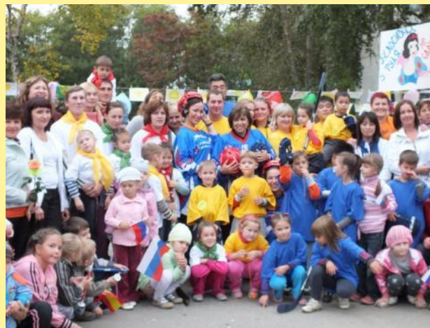
«В гостях- Ирина Роднина»