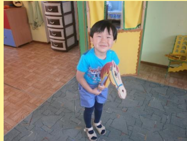
«Игра в лошадки»