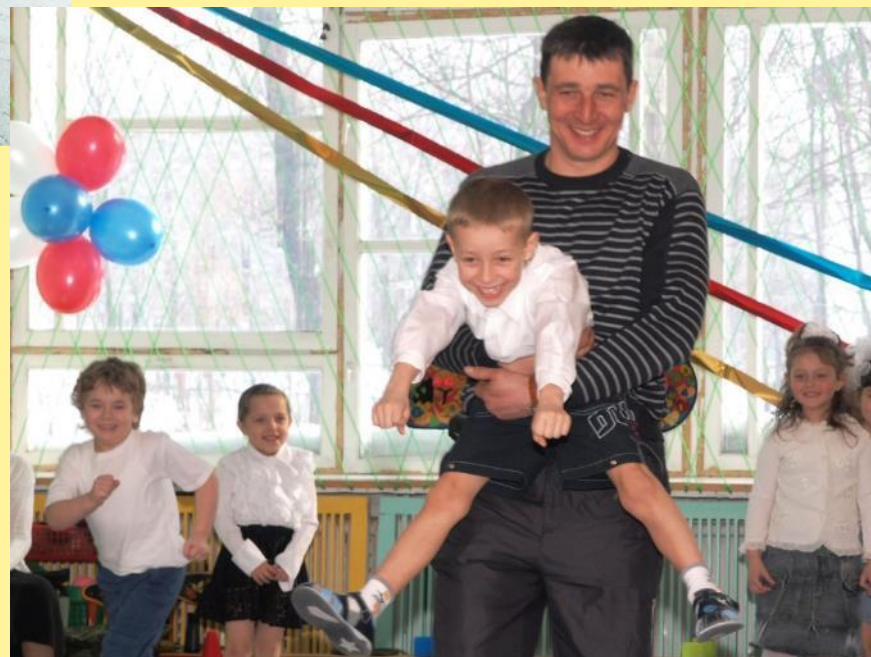
«Богатырская наша сила»