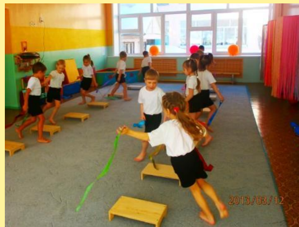
«Займи свой домик»