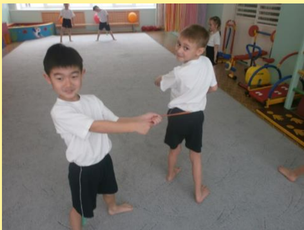
«Ловишка, бери ленту»