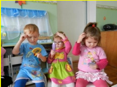
Игра «Части тела»