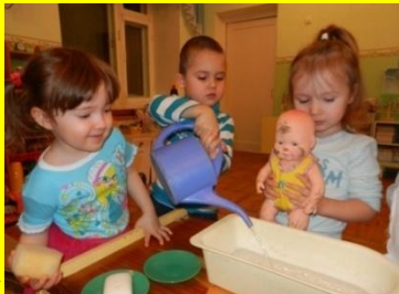
«Моем, моем грубо шета – Чисто, чисто, чисто, чисто!»