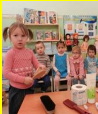
«Загадки от Мойдодыра»