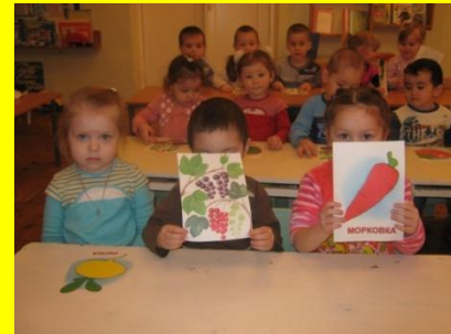
«Чем полезны овощи»