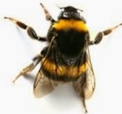
Шмель земляной ( Bombus terrestris )