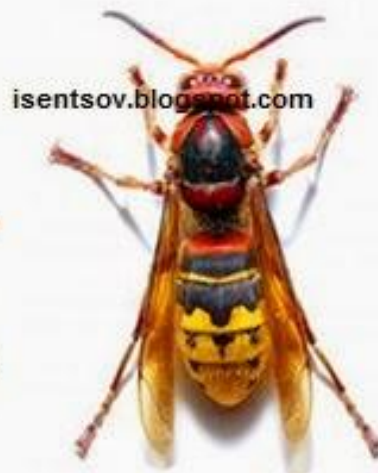
Шершень европ. ( Vespa crabro )