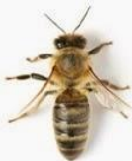
Пчела медоносная ( Apis mellifera )