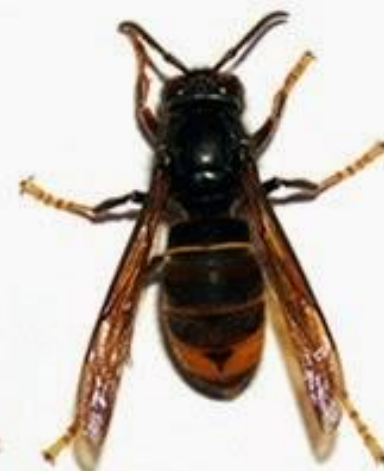
Шершень азиатский ( Vespa velutina )