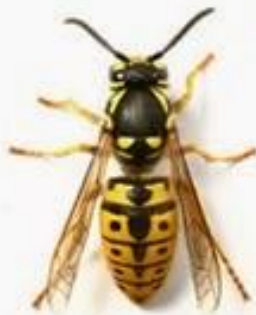
Оса обыкновенная ( Vespula vulgaris )