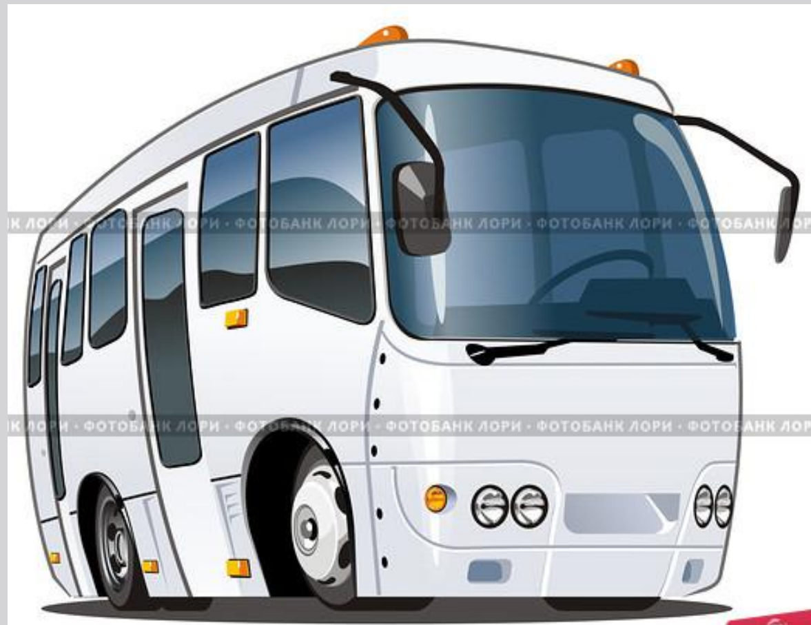
Мультяшный автобус

Что за чудо светлый дом? Пассажиров много в нем. Носит обувь из резины И питается бензином.